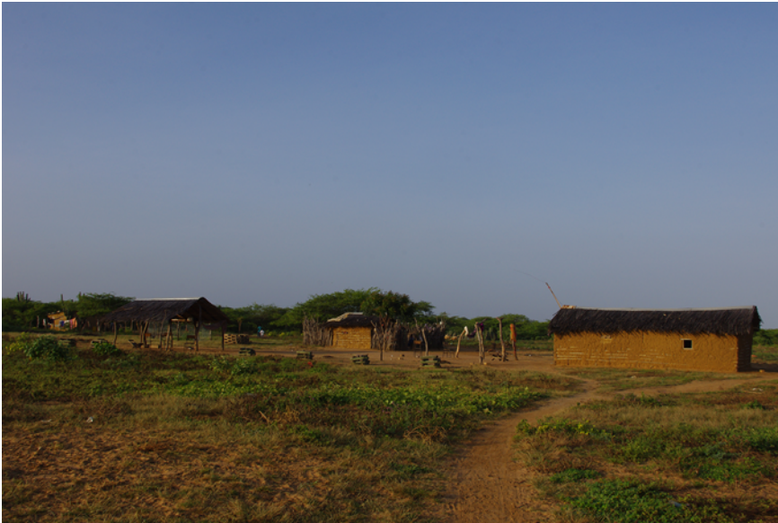
Figure 1 Habitat wayüue. De gauche à droite : auvent, cuisine, case