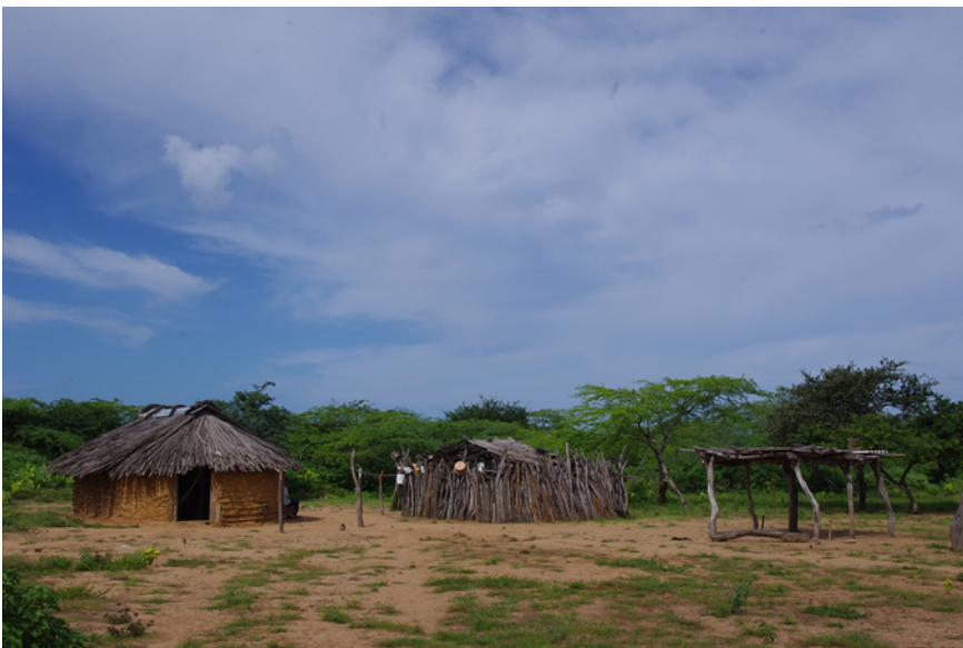
Figure 2 Habitat wayüue. De gauche à droite : case, cuisine, auvent

comme des signes : ils sont à interpréter et à lire. En saisir les ressorts impose dès lors des capacités de discernement et d'interprétation. Cette manière particulière d'envisager les événements décourage le rangement des êtres qui les entourent dans des catégories stables et figées. Pour les identifier et agir convenablement vis-à-vis d'eux, les Wayüus prennent au contraire très au sérieux les contextes dans lesquels ils se manifestent. Ceux-ci sont en effet capables de moduler le sens que revêtent leur présence et leurs comportements.