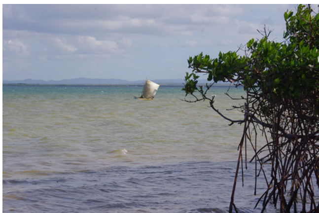
Figure 4 Pirogue wayùue, avec voile déployée