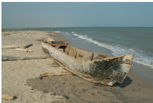
Figure 6 Pirogue wayùue