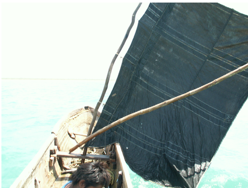
Figure 5 Pirogue wayùue, vue à bord

du poisson, laquelle trahit son inclination pour les animaux marins en général :