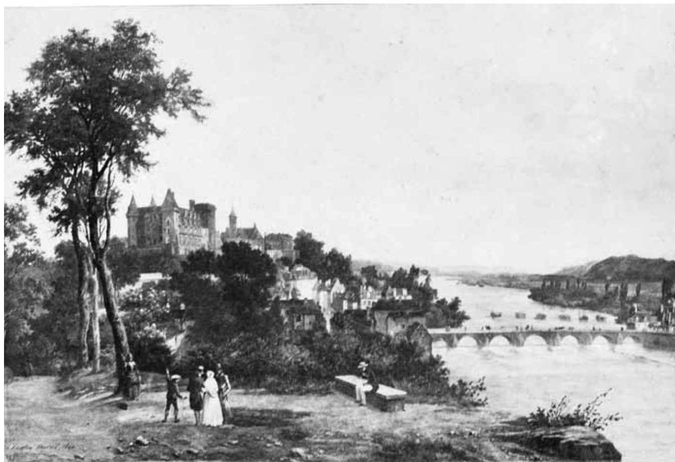
Figure 1. Édouard Baldus, Sans titre , épreuve sur papier salé, 22 x 33 cm, Paris, entre 1850 et 1859 © J. Paul Getty Museum.

L'affinité entre le travail de la matière picturale et celui de la matière photographique pénètre aussi les descriptions d'atelier. Peintres et photographes doivent lutter contre l'odeur des produits chimiques qui indispose les visiteurs et doivent se prémunir des taches en suivant les conseils dispensés par La Lumière , qui pousse l'analogie jusque dans le cabinet de toilette : « En résumé, étant données des mains chargées de produits photographiques aussi riches en tons et couleurs que la palette de Delacroix et de Diaz, on pourra toujours les rendre plus blanches et nettes en procédant de la manière suivante 18 [...] ». Cette comparaison sert d'introduction à une liste de recommandations numérotées impliquant l'usage d'acide hydrochlorique, de soude ou encore de cyanure de potassium, autant d'indices rappelant que l'auteur s'adresse à des spécialistes. De plus, l'analogie avec la peinture fondée sur la création des couleurs, les mélanges savants de pigments et de produits chimiques renvoie d'autant plus à une pratique traditionnelle que les peintres des