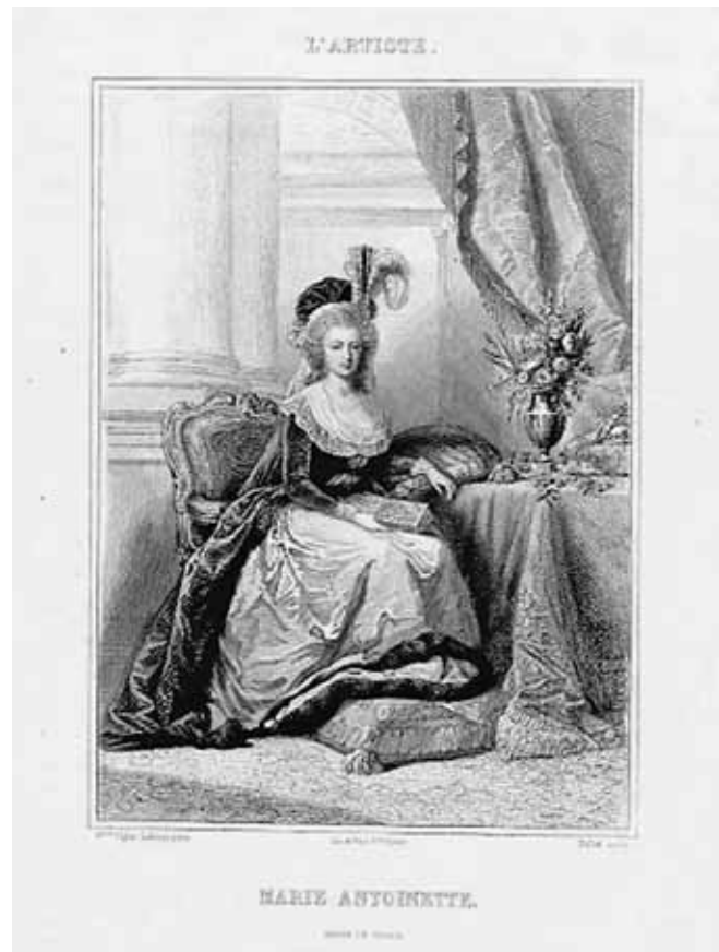
Figure 2. Victor Florence Pollet, Portrait de Marie-Antoinette d'après Élisabeth Vigée-Lebrun, Finot & Bougeard (imprimeurs), Charles Paul Furnes (éditeur), gravure à l'eau forte, 27 x 20 cm, Paris, entre 1830 et 1880 © British Museum.

La reproduction de tableaux étant particulièrement propice à la cristallisation de telles interrogations, cette question, qui semblait être résolue dès l'apparition du daguerréotype 42 , s'est imposée dans le cadre des débats ayant placé en concurrence la gravure et la photographie pour la reproduction d'œuvres picturales 43 (fig. 2). Bien que les amateurs aient encore été sensibles à la faculté que l'on prêtait à la gravure de rendre compte de la couleur, son caractère graphique semblait la destiner davantage que la photographie à la reproduction du dessin 44 et donc de la gravure elle-même. Les discours entourant la concurrence entre graveurs et photographes abordaient des questions d'autant plus épineuses que les enjeux n'étaient pas seulement artistiques, mais aussi financiers. Comme le suggère l'ambiguïté lexicale, le problème de la reproduction du réel se mêlait à celui de la reproduction