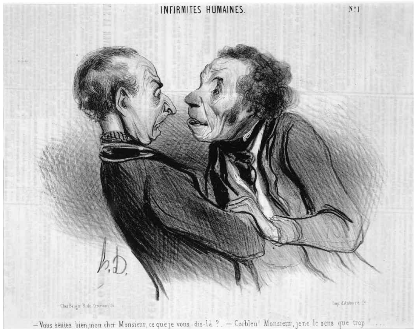
Figure 2. Honoré Daumier, Infirmités humaines n°1, 1840, lithographie, 25,9 x 35,1 cm, Dallas, Dallas Museum of Art (Photo : © Dallas Museum of Art).

comme des chênes, imprégnée de la forte odeur des vaches, plate ou accidentée [...] » 46 . Un peu à la manière de la Galatée de Gérôme, la représentation paraît n'être qu'un moment de transition dans la transformation de la matière picturale en élément naturel. En effet, lorsque la représentation a su faire oublier sa matérialité originelle, l'odeur de la peinture disparaît au profit de celle de la nature représentée, propice à l'exercice de la mémoire affective et, encore une fois, à la reconnaissance du pays natal : « Eh bien, le sentiment exquis de localisme dont cette chaude petite toile est imprégnée lui donne une importance capitale ; elle embaume l'Italie à ce point qu'un Romain aveugle ne s'y tromperait pas. » 47