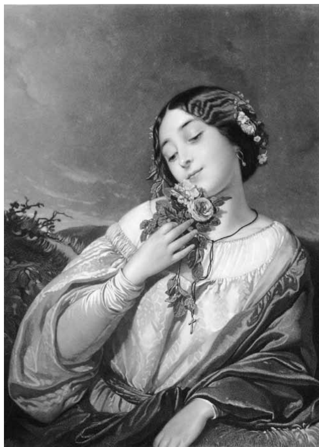
Figure 5. H. Garnier, d'après un tableau de Schlesinger, L'odorat , 1850, gravure, 49 x 35 cm, Londres, British Museum.

En contrepartie, plusieurs critiques évoquent l'odeur émanant du tableau pour indiquer qu'ils ont flairé l'allégerie à l'académisme et aux conventions bourgeoises 73 . Zola écrit ainsi : « Je ne peux malheureusement pas rendre justice à l'aspect élégant de cette dame – une sultane de harem typique – ni faire sentir tout le parfum de poncif et de bêtise bourgeoise exhalé par ce tableau » 74 , tandis que Castagnary commente en ces termes, relevant du dégoût, un tableau de Bouguereau : « Son groupe a une vague odeur de patchouli et de pommade. C'est doux et écœurant » 75 . Opposer les valeurs de l'artiste à celle des bourgeois 76 n'est cependant pas le seul ressort de ces critiques d'art quant à l'olfaction. Les tenants du réalisme ont également mêlé les arguments esthétiques à la critique olfactive en soulignant l'usage du noir par la peinture académique et la peinture romantique, les deux écoles dont ils distinguent le réalisme. Zola, par exemple, file cette métaphore dans son roman sur l'art :