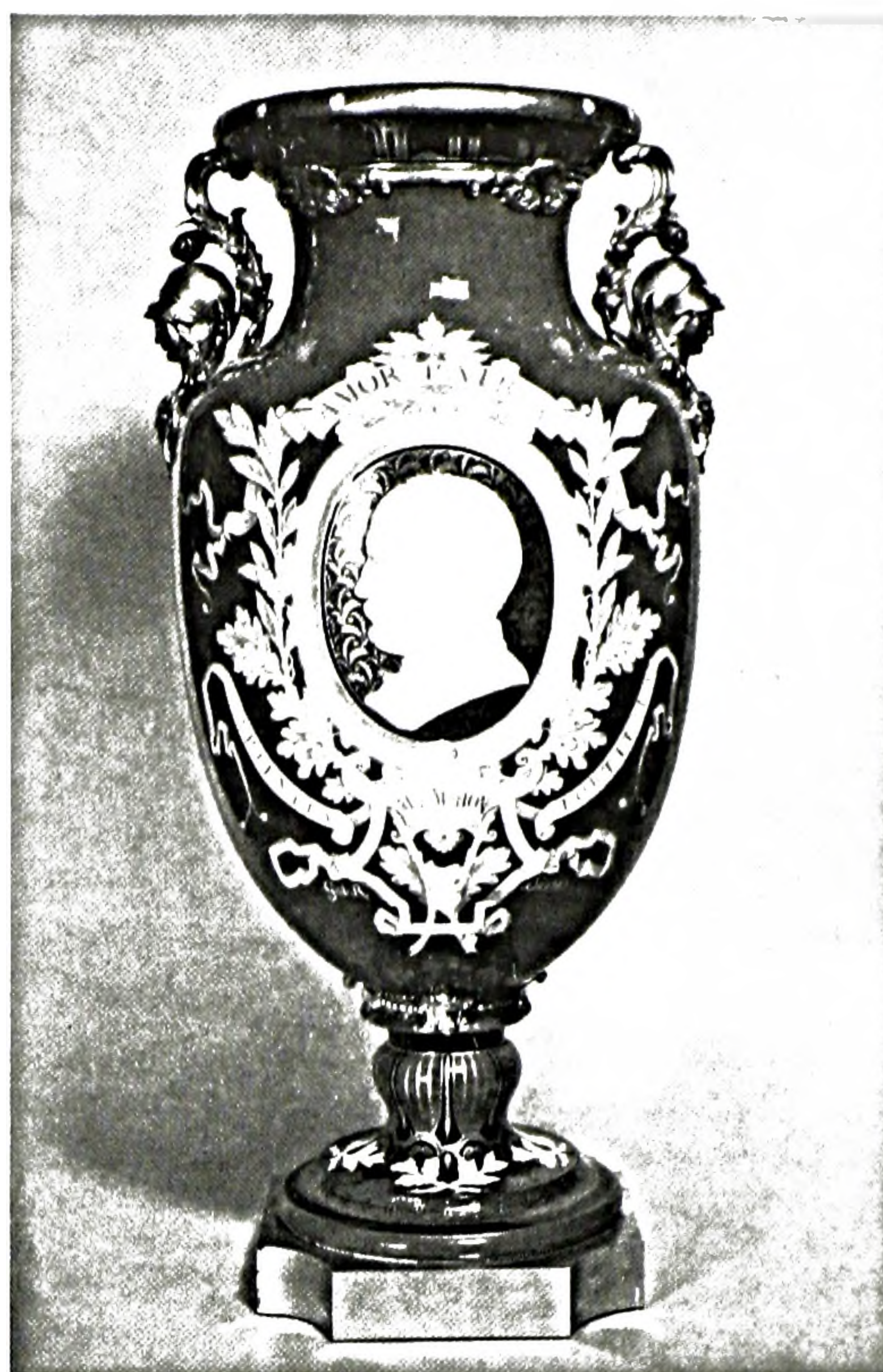
FIGURE 6. Vase de la vendange ; portrait de Mac-Mahon et ornements en pâte blanche par Alfred-Thompson Gobert, 1873-74. Porcelaine de Sèvres, 89,2 × 43,8 cm. The Cleveland Museum of Art, collection Thomas L. Fawick.

Ces objets furent de nouveau présentés en 1851 à Londres lors de la première Exposition univer-