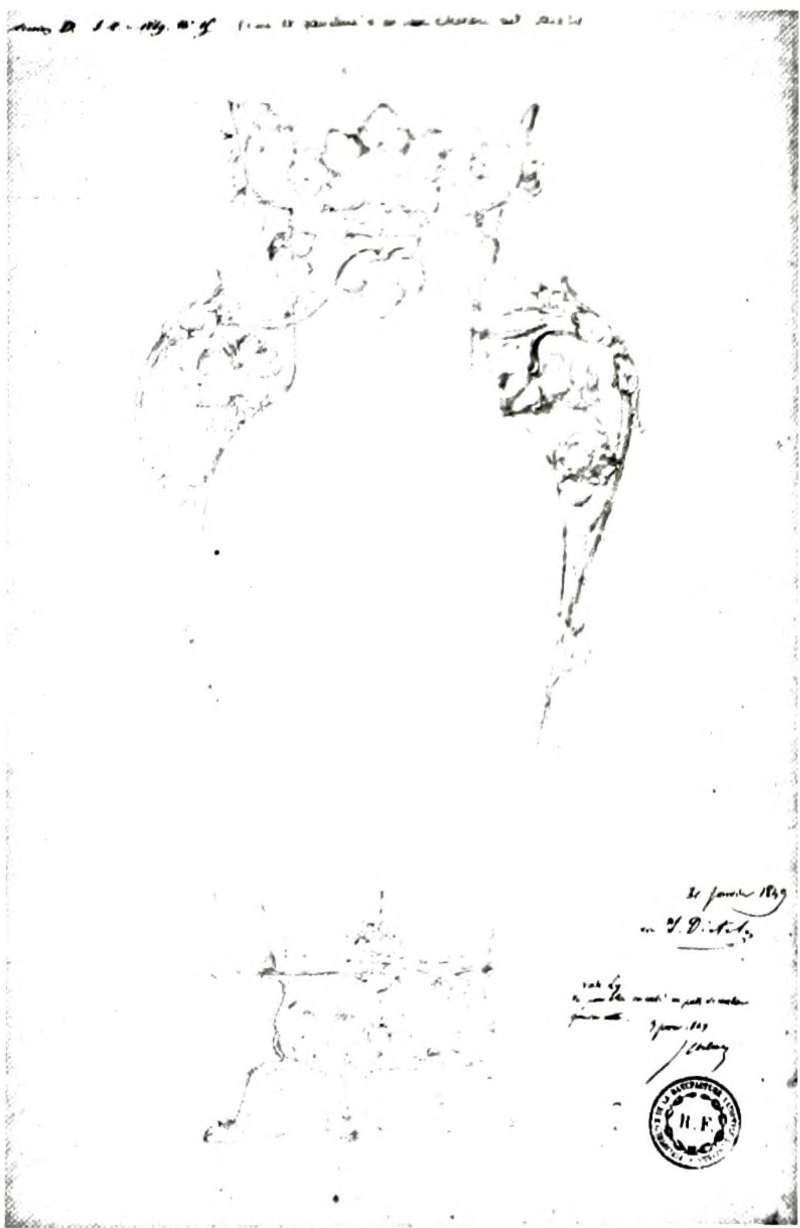
FIGURE 3. Jules Dieterle, Projet de monture en bronze pour vase Ly (1849). Manufacture nationale de Sèvres, Archives.