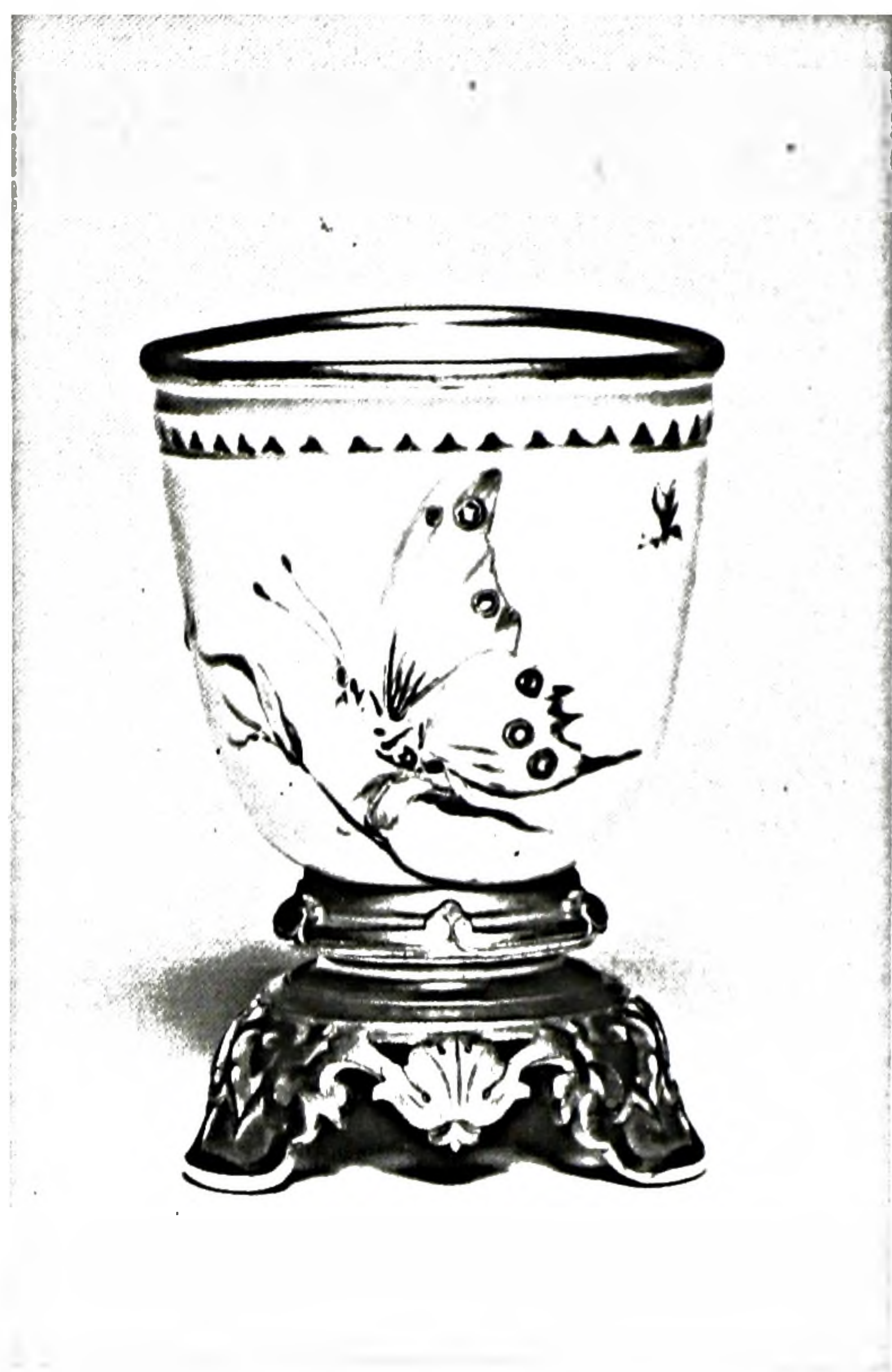
FIGURE 4. Sucrier, porcelaine de Sèvres, orné en pâtes blanche et de couleurs (1849). Sèvres, Musée national de céramique.

lors de l'exposition annuelle des produits des manufactures royales en 1838 11 . Parmi ces fonds, on trouve le vert céladon qui servit presque seul de base aux premiers décors en « pâte sur pâte ». Autre nouveauté, ces fonds furent étudiés pour être posés par immersion et par engobage. Cette recherche, curieusement, amena une autre mise au point : les couleurs préparées en 1832, abandonnées, avaient séché ; d'après Bunel, ce furent elles qui servirent en 1840 au chef des pâtes lorsqu'il mit au point pour le sculpteur Hyacinthe-Jean Régnier (à Sèvres de 1825 à 1863) des pâtes colorées pouvant être incrustées dans l'objet à décorer afin d'imiter les pièces en faïence « Henri II » alors tellement à la mode.