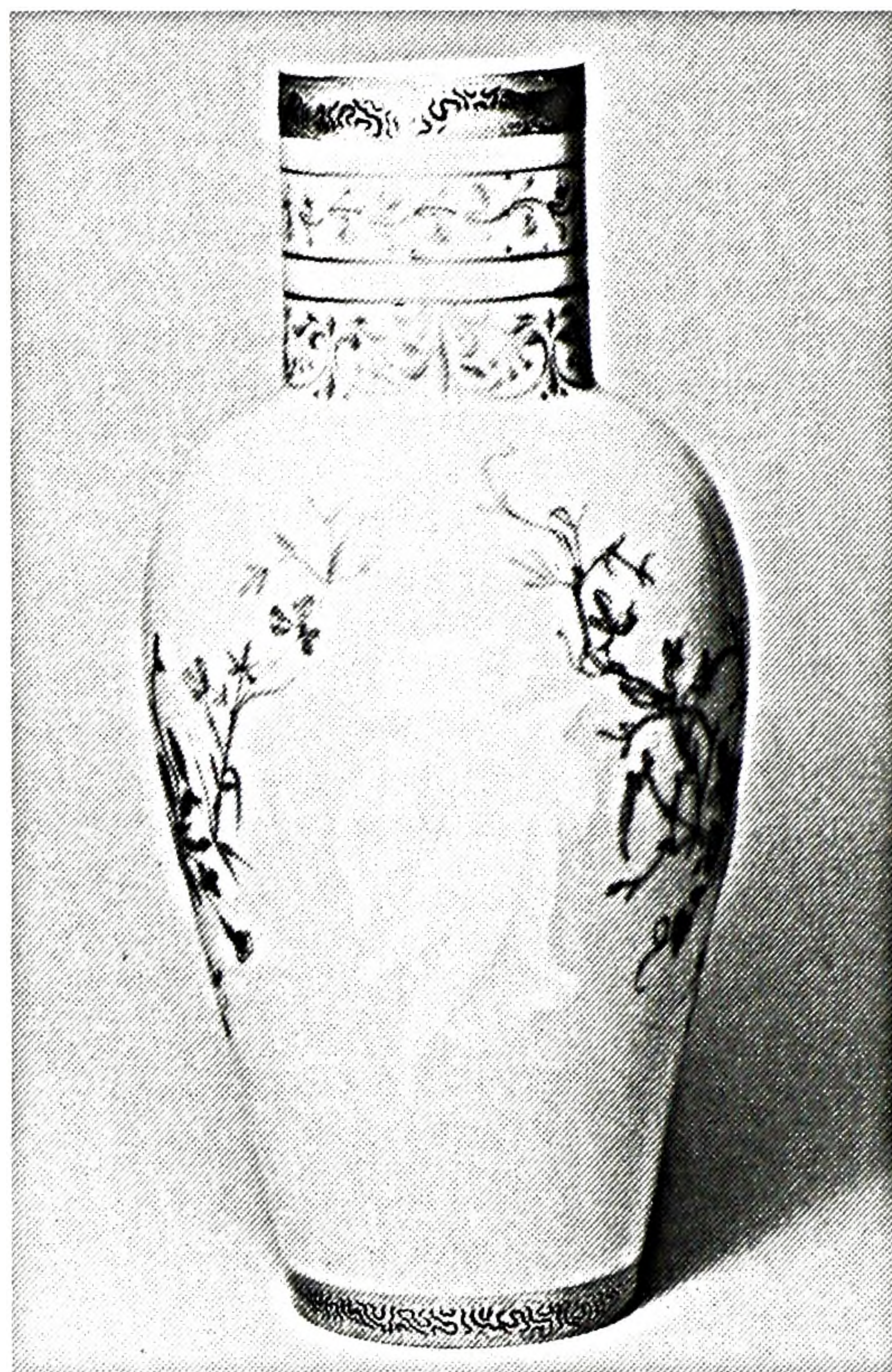
FIGURE 5. Vase Ly, porcelaine de Sèvres, décoré en pâtes blanche et de couleurs (1850). Sèvres, Musée national de céramique.

Notons tout de suite que ces deux essais ne sont pas absolument semblables à ce que nous appelons aujourd'hui « pâte sur pâte »; nous avons tendance à réserver ce nom à des pièces décorées en pâte blanche sur un fond coloré; or les descriptions ci-dessus et les mentions d'archives prouvent que les premières pièces furent faites à Sèvres en pâtes d'application aussi bien colorées que blanche, et souvent même associées à des éléments de décor plus traditionnels, telles les « palmettes en bleu sous couverte » de la pièce d'essai 14 .