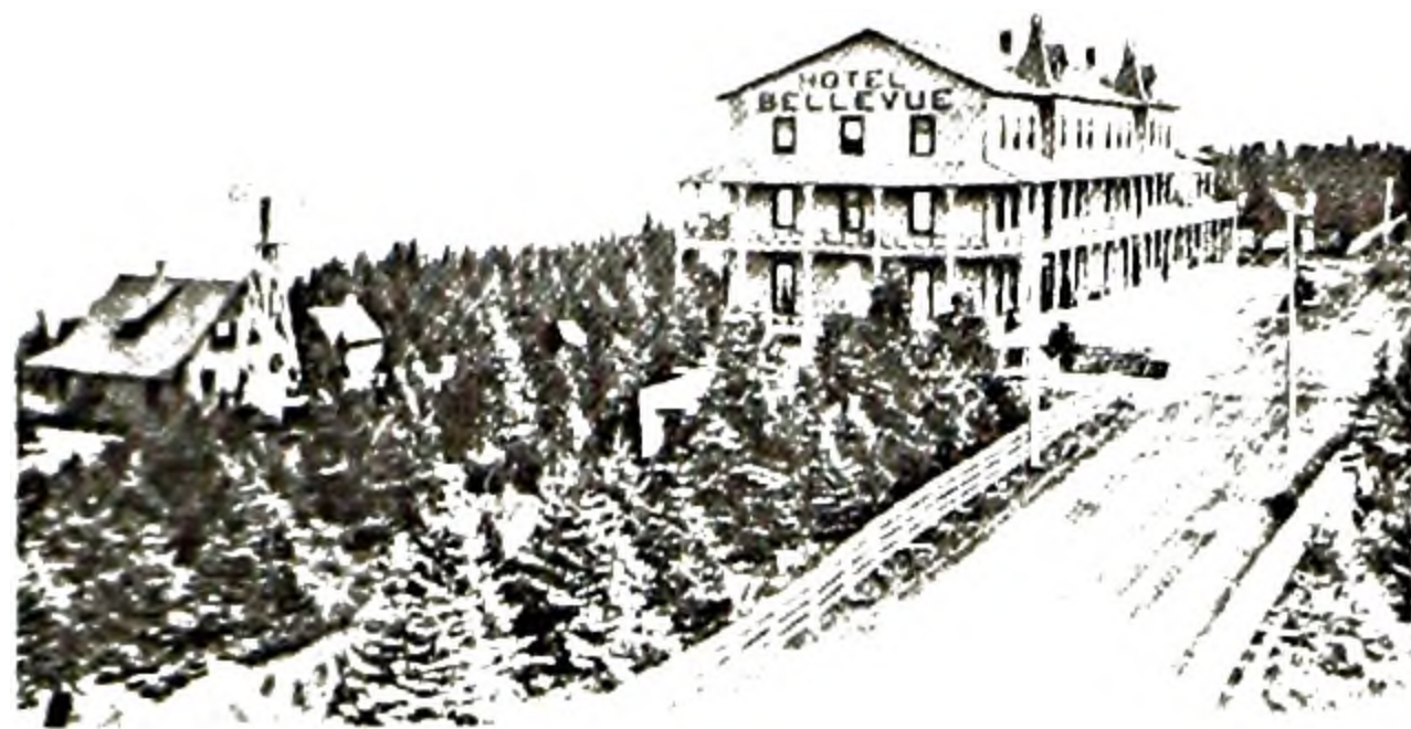
FIGURE 1. Hôtel Bellevue, Rivière-du-Loup. Caron, p. 69.

renseignements techniques et un titre anglais identifiant les négatifs apparaissent même sur chacune des enveloppes.