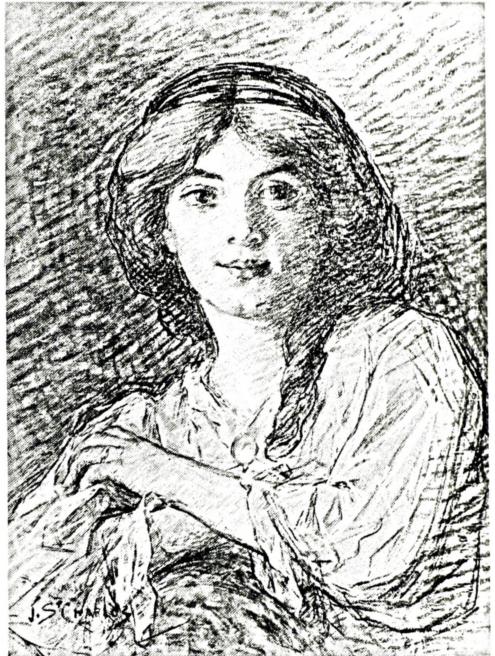
FIGURE 2. J. Saint-Charles, Jeune fille aux bras croisés , fusain rehaussé de pastel. Collection inconnue.

ment des cours sous la direction de Jean-Paul Laurens 19 et à la suite de deux échecs consécutifs dans des concours d'art, il se classe en 1890 quinzième (sur 80) dans un concours à l'École des Beaux-Arts de Paris et cinquième (sur 253 exposants) dans un autre concours grâce à la copie d'un tableau, La Défense de la Barrière de Clichy d'Horace Vernet (1789-1863) 20 , tableau qu'il exécute entre octobre 1889 et avril 1890 21 et qui lui ouvre les portes du Salon de Paris tout en lui accordant le droit de compétition pour le grand prix de Rome 22 .