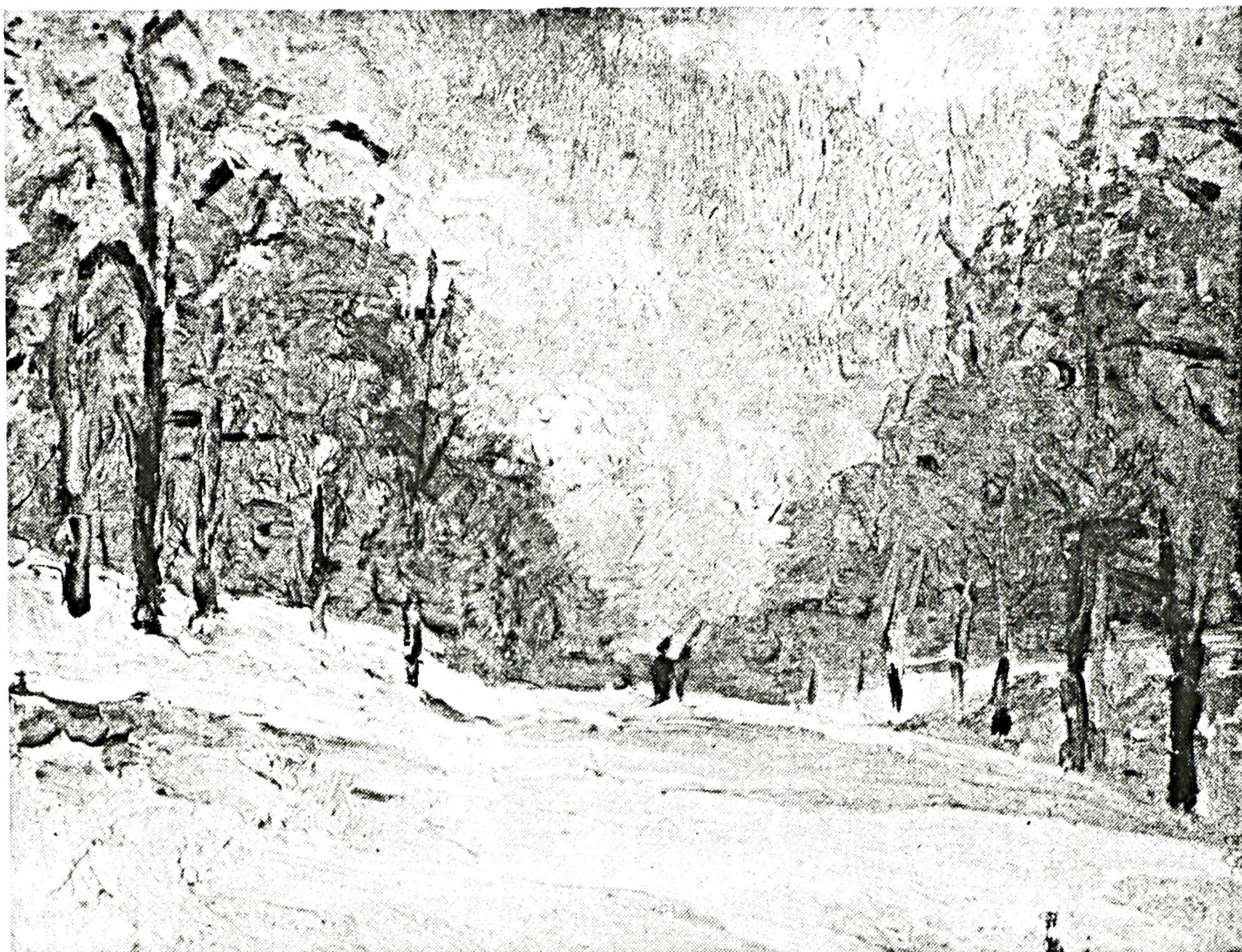
FIGURE 8. J. Saint-Charles, Promenade , huile sur toile. Collection de Mademoiselle Anna Saint-Charles.