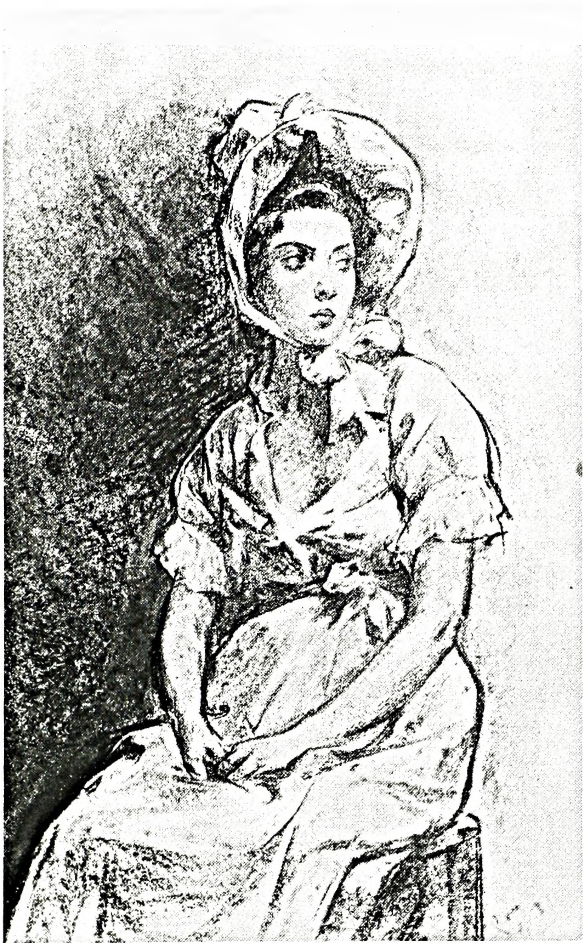
FIGURE 3. J. Saint-Charles, Jeune fille assise , fusain rehaussé de pastel. Ottawa, Collection du Centre de recherche en civilisation canadienne-française, Université d'Ottawa.

alors avec Franchère les peintures de la chapelle du Sacré-Cœur de l'église Notre-Dame de Montréal 24 commandées par le curé Sentenne. Trois tableaux seront exécutés par Saint-Charles, La première messe à Montréal , Le serment de Dollard et de ses compagnons et L'adoration des mages , le tout pour la somme de $1750, ce qui permettra à Saint-Charles de poursuivre plus longuement son séjour à Paris 25 . Au début de l'année 1891 il remporte la médaille d'or offerte par le gouvernement français, ce qui le rend hors concours à Paris 26 . Il revient