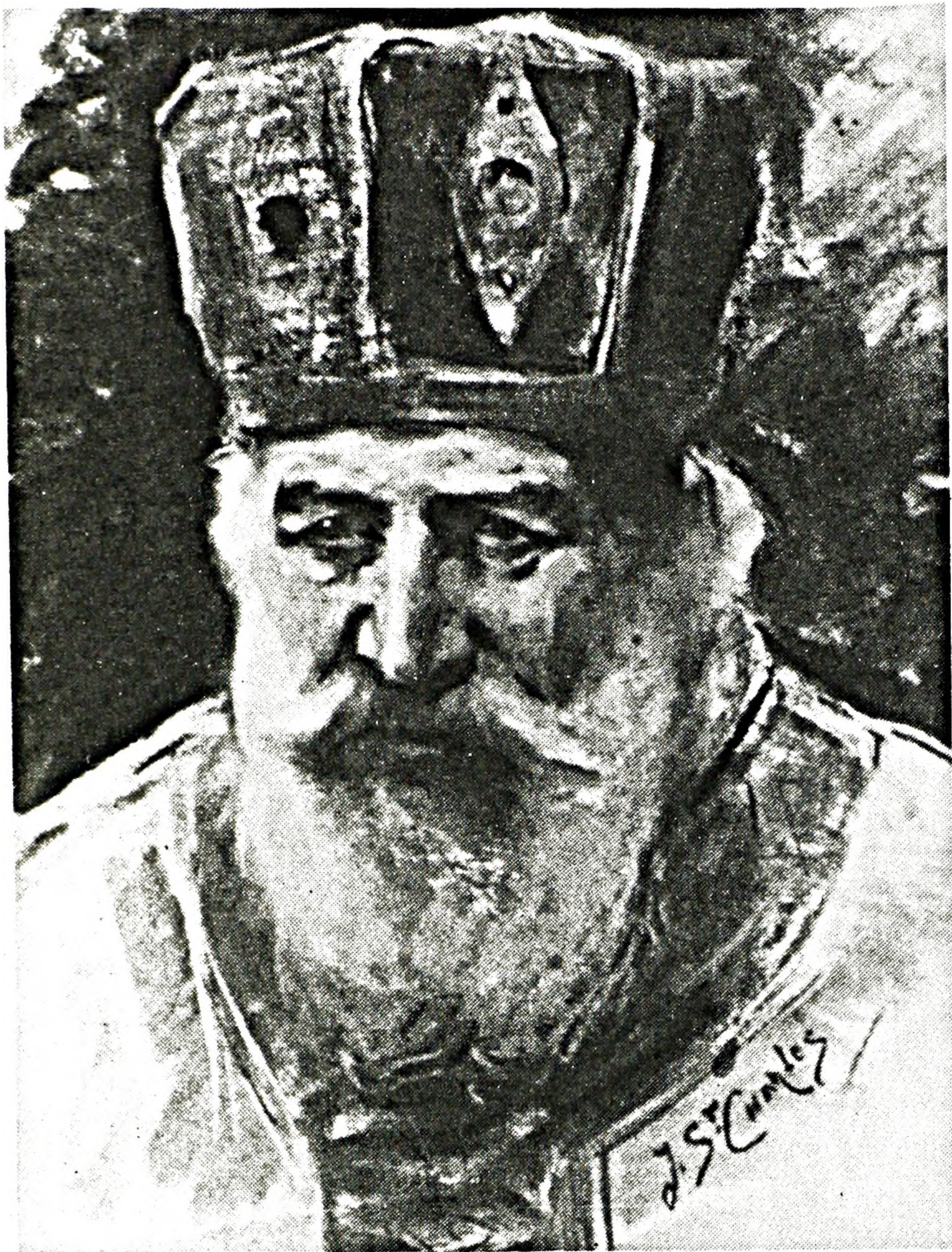
FIGURE 1. J. Saint-Charles, Le Grand Prêtre , pastel. Collection particulière. Il s'agit d'une étude préparatoire d'un personnage de La Présentation de la Vierge au Temple .

facilement s'appliquer à des centaines d'autres. « L'histoire de l'art s'est dégradée en expertise et a conçu son rôle social comme un service offert à la caste des possédants. Elle est devenue moins une histoire qu'un art » 5 .