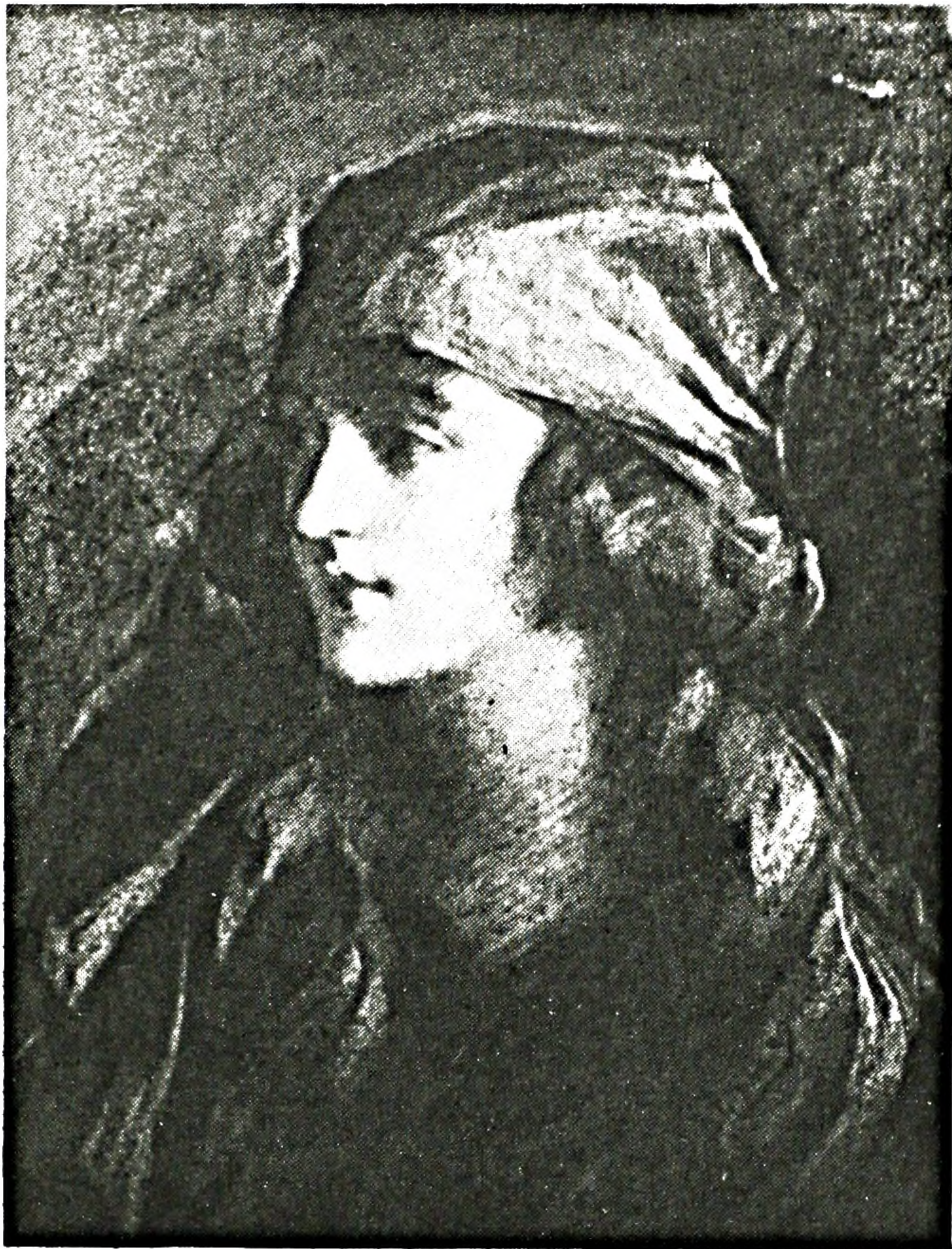
FIGURE 10. J. Saint-Charles, Jeune fille au turban , fusain et pastel. Collection de Madame Marthe Deslandes.

la suite surtout des paysages et très peu de commandes officielles; il décède à Montréal le 26 octobre 1956, à l'âge de 88 ans. Après sa mort il n'a connu qu'une seule exposition collective en 1962 75 , et deux expositions individuelles, l'une en 1966 à Montréal, alors que trente-sept tableaux étaient présentés 76 , la seconde et dernière en 1971 à l'Université d'Ottawa 77 .