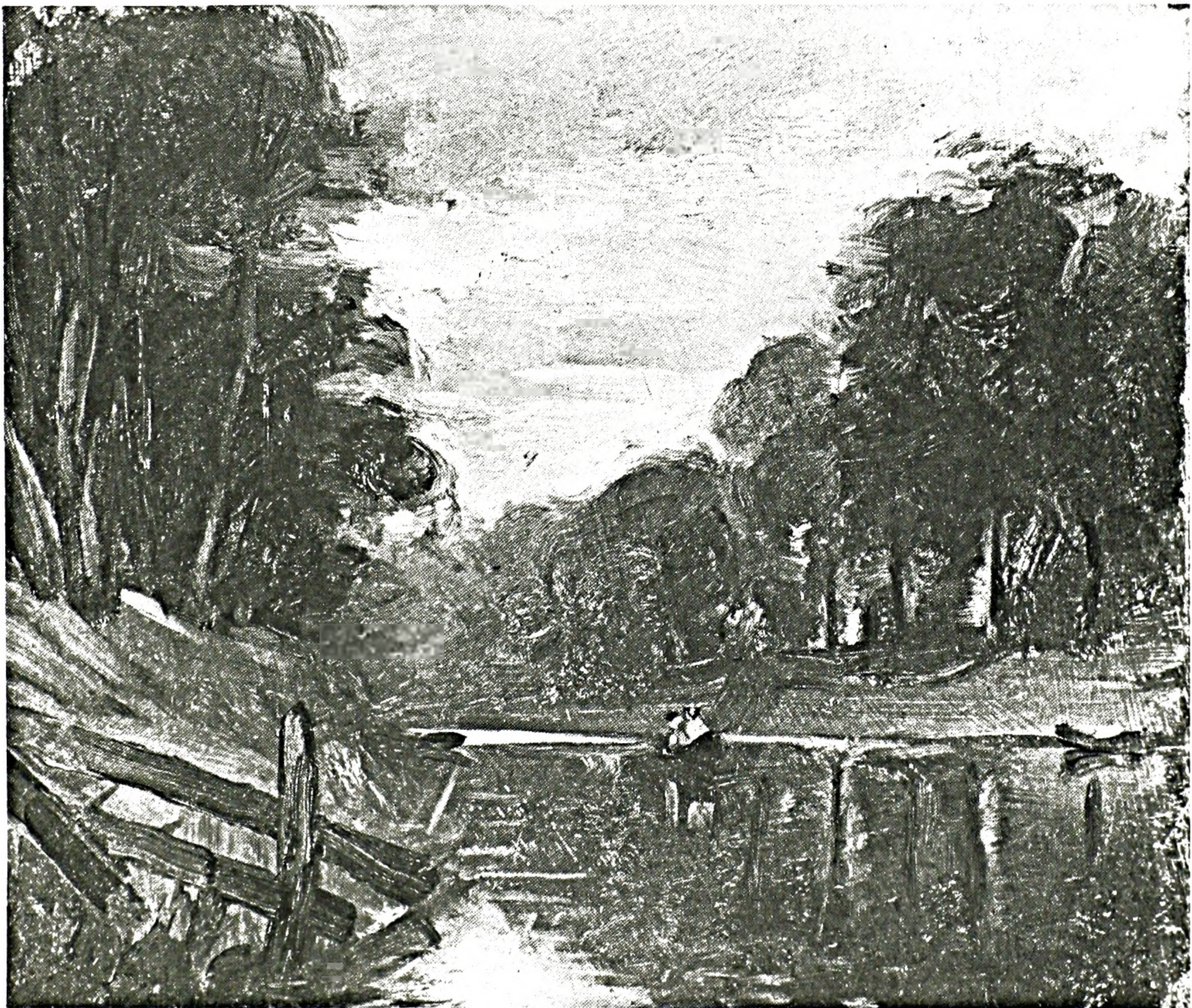
FIGURE 7. J. Saint-Charles, Paysage , huile sur toile. Québec, Musée du Québec.