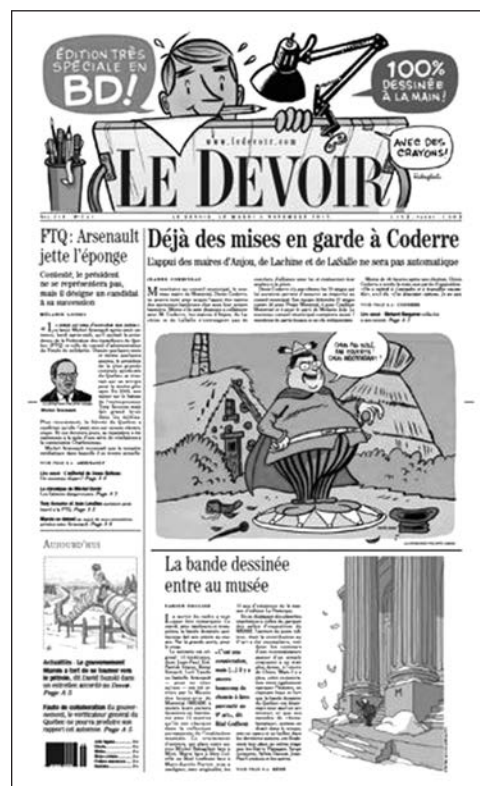
La une du Devoir , le 5 novembre 2013.

De toutes ces formes les plus diversifiées de texte illustré, celle qui en constitue une sorte d'archétype est la BD, véritable modèle de multimodalité appliquée. De plus en plus réaliste, et notamment documentaire 4 , il n'en demeure pas