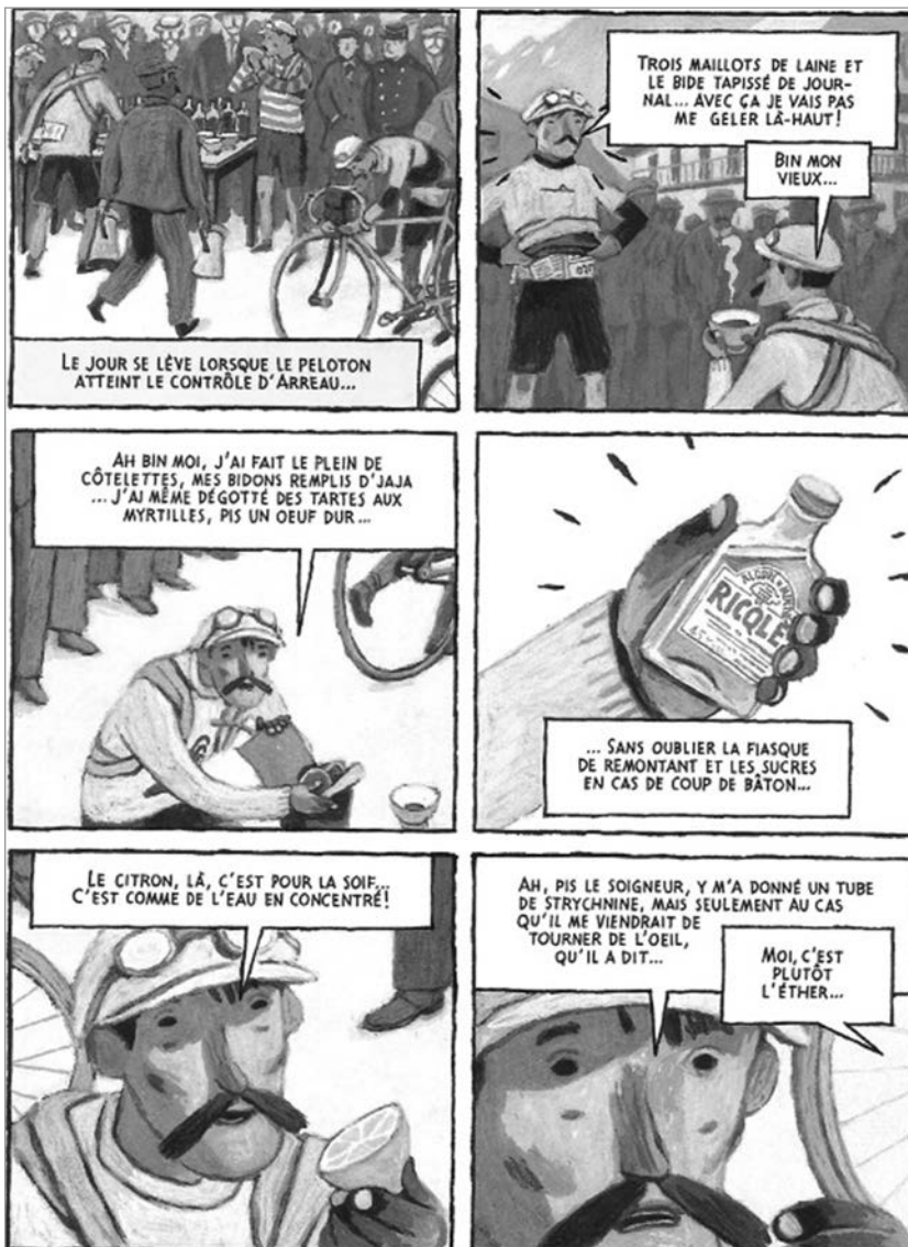
Figure 1. Nicolas Delon, Le tour des géants , Paris, Dargaud, 2009.

Ici, demandez tout simplement à vos élèves de lire un extrait de BD élagué de toute forme de texte ; répétez ensuite l'expérience, cette fois-ci avec un extrait dépouillé de tout repère visuel... Dans les deux cas, le constat sera exactement le même : impossible de saisir correctement l'ensemble du sens du récit sans l'un ou l'autre des modes sémiotiques ! D'où la nécessité de s'attarder, en lecture multimodale, à la compréhension des images, certes, mais aussi à celle des mouvements, des sonorités ou du texte ainsi qu'à leurs différentes combinaisons sémantiques. Or, contrairement à ce qui prévaut en France, le Québec n'exige pas encore de ses maîtres de la classe de français qu'ils s'attardent à la compréhension du sens porté par l'image, ce qui devient, vous en conviendrez, de plus en