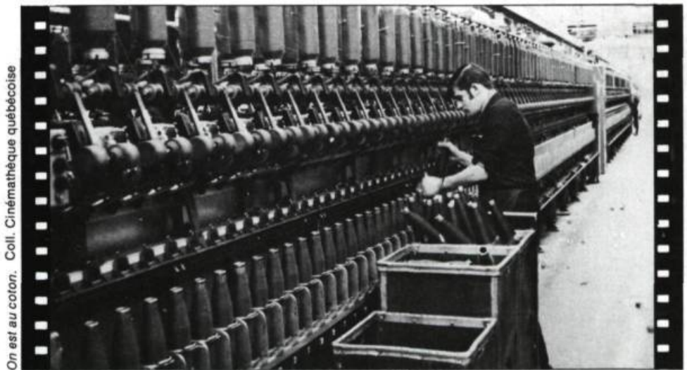
On est au coton.