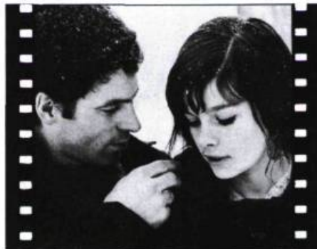
Entre la mer et l'eau douce.