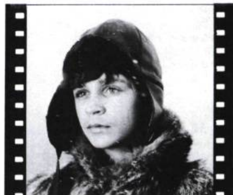
Mon Oncle Antoine

Ainsi, le cinéma québécois (autant que canadien) est sujet, comme n'importe quel secteur du travail, à l'inflation et au chômage. Ainsi, il y a de moins en moins de films qui se font, parce que de plus en plus chers, et plus un film est cher, plus il doit ressembler à un produit de consommation courante et immédiate.