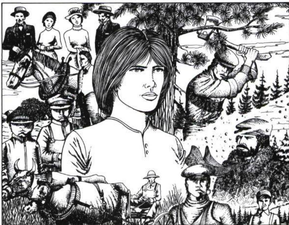
Extrait de la bande dessinée Maria Chapdelaine (Éd. Héritage)