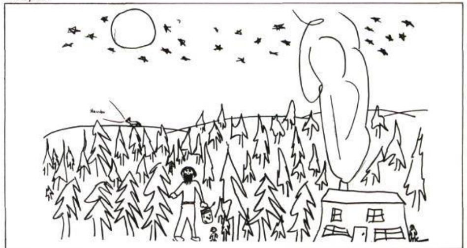
Pourquoi t'a-t-on abandonné?