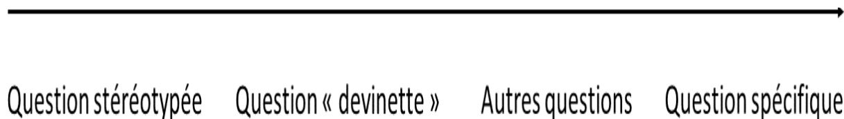
Figure 1 : continuum des quatre premiers types de questions observées avec la grille MGP

Les questions « devinettes » sont des questions sans support fourni aux élèves pour leur permettre de répondre (une vidéo, des explications orales...). Par conséquent, seuls les élèves qui connaissent déjà les réponses (grâce à leur milieu familial par exemple) peuvent répondre. Les autres questions sont toutes les autres questions sur le contenu. Elles sont plus élaborées que les questions stéréotypées et les questions devinettes, mais pas aussi élaborées que les questions spécifiques. Deux autres types de questions sont également observés : les questions métacognitives , par lesquelles l'enseignant encourage la métacognition, qui peut être définie comme « l'habileté à réfléchir sur sa propre pensée » (Gauthier, Bissonnette & Richard, 2013, p. 301) (ex. : « Par quelles étapes es-tu passé pour arriver à cette réponse ? ») et les questions par lesquelles l'enseignant demande l'avis des élèves / fait appel à leur expérience personnelle et/ou professionnelle (ex. : « qu'est-ce que vous avez pensé de la vidéo ? »).