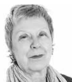
Par MICHÈLE BERNARD*

En ces temps de pandémie, et partant d'incertitude, on constate sans étonnement que les femmes sont davantage touchées par la crise que leurs compagnons. La calamité mondiale n'a-t-elle pas été baptisée She-cession , ou récession au féminin ? Un terme percutant qui résume combien est (re)devenue inégale et injuste la répartition des revenus entre les sexes, tout comme le partage des tâches et des responsabilités familiales ou scolaires.