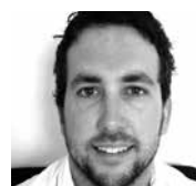
Par DAVID LAPORTE*

Dire du jeune auteur originaire de Maria en Gaspésie qu'il ne manque pas d'ambition relève de l'euphémisme. Celui qui est également traducteur pour le Quartanier et réside maintenant