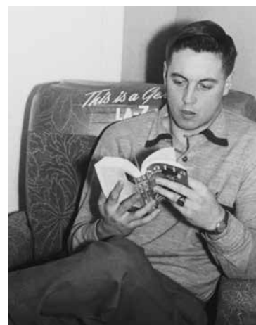
Les éditions Marabout, Bob Morane et le Québec (Septentrion, 2019)