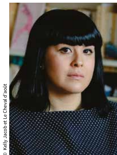
© Kelly Jacob et Le Cheval d'août