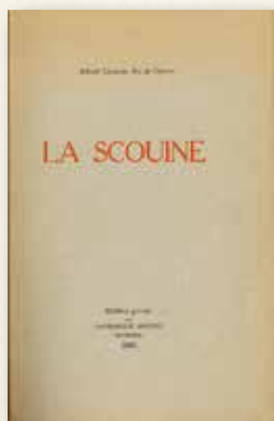
Édition originale de 1918

E n tout cas, voilà à peu près ce que je savais lorsque, il y a cinq ans, j'ai lu La Scouine pour la première fois. Ce que j'ignorais, c'est que venait de s'enclencher un irrésistible mouvement qui me conduirait d'abord à réécrire le roman, puis à poursuivre au doctorat mes recherches sur cet écrivain fascinant, auteur non pas d'un seul livre, mais de quinze, dont le dernier, Lamento , sans doute trop sulfureux pour qu'il ose le publier de son vivant, dort encore dans les archives du Centre de recherche en civilisation canadienne-française de l'Université d'Ottawa.