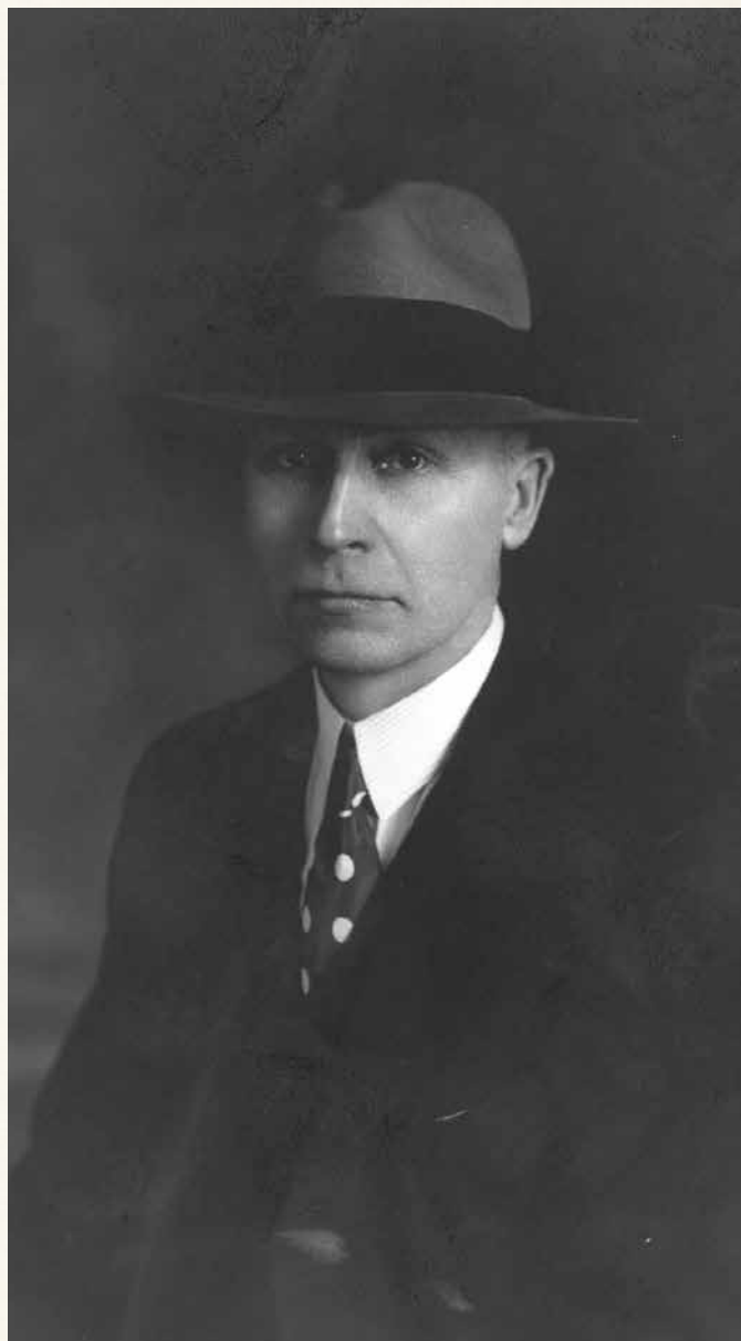
Albert Laberge vers 1930

Roman de la misère et du non-dit, La Scouine d'Albert Laberge était devenu, sous ma plume, celui des pulsions inavouées et des désirs enfouis. En choisissant cette voie, avais-je trahi l'esprit de mon prédécesseur, ou étais-je parvenu au contraire à saisir le mouvement intime de son œuvre, son élan secret ? Cette question, je me la suis bien sûr posée lorsque j'ai décidé d'approfondir ma connaissance de l'écrivain dans le cadre d'un projet de doctorat.