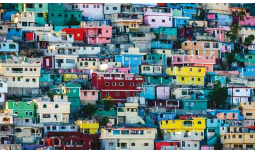
Quartier de Jalousie, Pétion-Ville