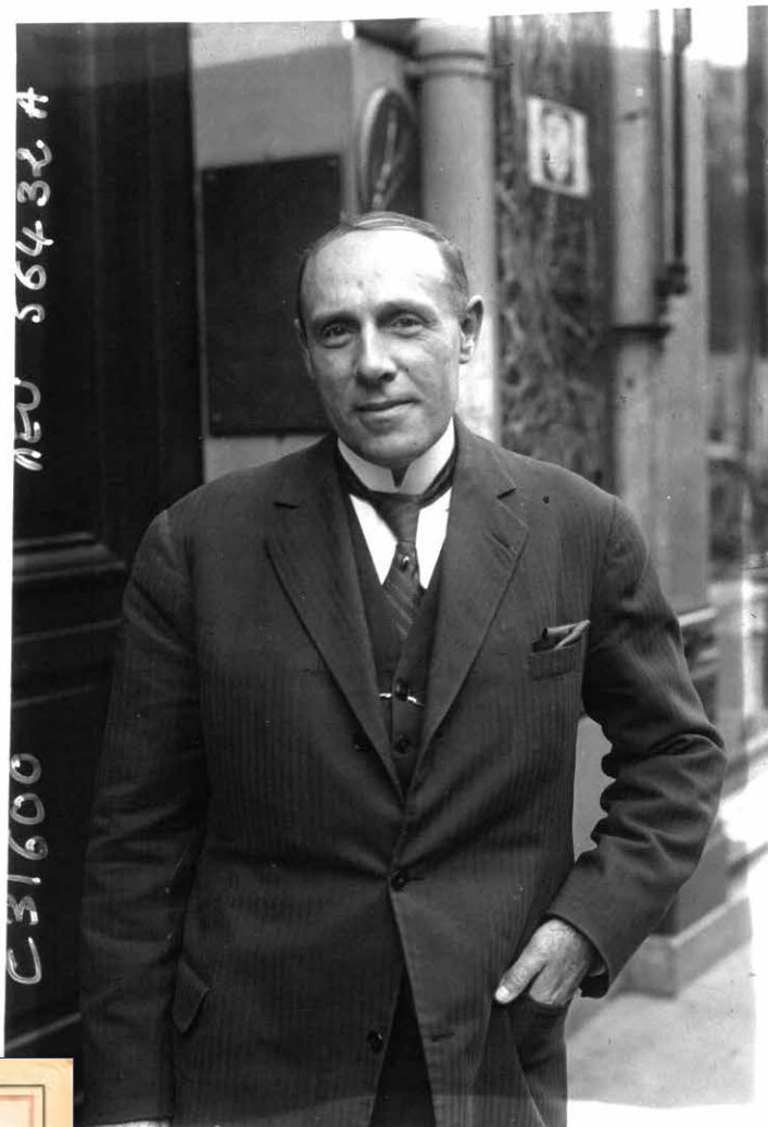
Luc Durtain en 1928

es poèmes furent admirés par ses contemporains Jules Romains, Édouard Dujardin, Guillaume Apollinaire ou Paul Éluard, tandis que ses romans et nouvelles furent loués par Albert Thibaudet, Benjamin Crémieux, Henri Barbusse, Philippe Soupault et Paul Morand, parmi bien d'autres. Sa relative compromission sous l'Occupation – il signa des articles littéraires et culturels dans le journal de Jean Luchaire Les Temps nouveaux – explique en grande partie son occultation de l'histoire littéraire. Ce subtil observateur du monde de l'entre-deux-guerres reste pourtant un jalon important dans la compréhension de la modernité littéraire.