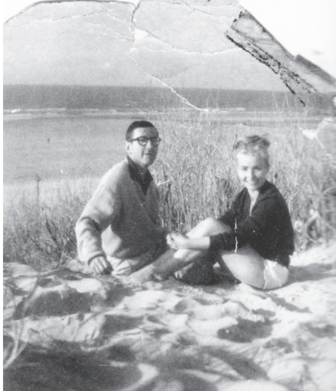
© Archives Marie-Andrée Beaudet / Pierre Nepveu, Gaston Miron, La vie d'un homme

Avec Denise Karas à Blankenberge vers 1960