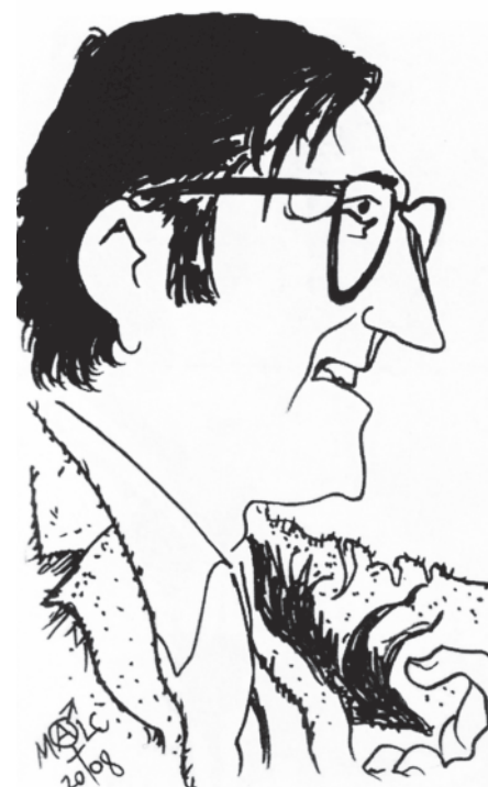
Miron par Malcolm Reid