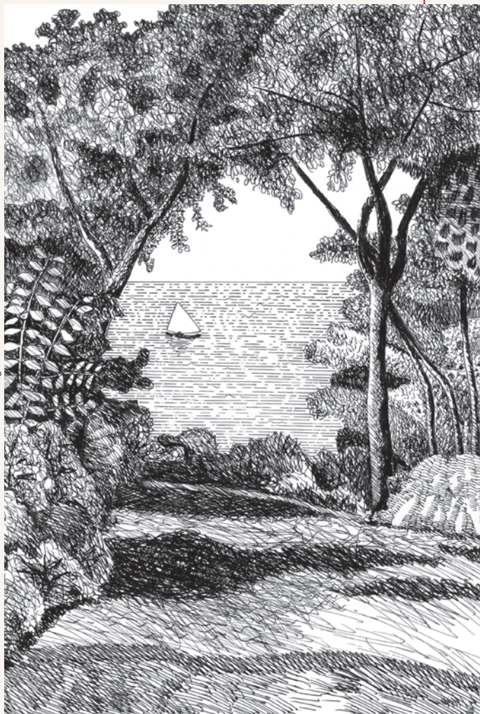
Dessin de Richard Aeschlimann tiré de La Grotte de Vénus , 2012.

Si une telle atmosphère de rêve est possible en plein cœur du pays calviniste, c'est en grande partie dû aux personnages mis en scène par Pierre Girard : qu'ils soient genevois, anglais ou américains, ils ont en commun non seulement une certaine familiarité avec les féeries shakespeariennes, à commencer par Le songe d'une nuit d'été , mais aussi une sensibilité musicale qui les porte volontiers vers les romantiques