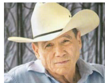
James Lee Burke

Vient de paraître la traduction de Rain Gods (2009) de James Lee Burke. L'auteur y délaisse la Louisiane et son personnage fétiche, le policier Dave Robicheaux, pour situer son enquête dans une petite localité du Texas. Intitulé, en français, Dieux de la pluie (Rivages), ce deuxième livre de la série Hackberry Holland (série de trois romans à laquelle le héros a donné son nom) débute avec la découverte macabre de neuf cadavres de femmes enterrés derrière une église.