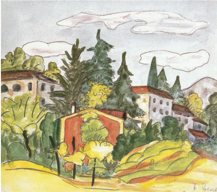
Aquarelle de Hermann Hesse, datée du 21 juin 1927

Goldmund (Bouche d'or) devra, lui, courir ce monde, exposé à ses séductions et à ses dangers pour que, au terme de son errance, il devienne un artiste véritable. La transformation, le choix même du parcours, n'est pas affaire de seule volonté consciente. Des rencontres inopinées viennent éclairer des impulsions intimes quand le sujet est prêt et le pousser à l'action. Se produit alors un bouleversement, une rupture, la sortie des vieilles peaux, le passage à un niveau supérieur de l'être. Siddharta fuit son confort princier, Josef Knecht renonce à sa prestigieuse fonction de maître du jeu des perles de verre. Ainsi en va-t-il pour le jeune Sinclair dans Demian , roman d'initiation parmi les plus intenses, les plus impétueux de Hesse. Il met en scène avec une netteté presque démonstrative le processus d'individuation, fondement de l'œuvre de Jung – avec qui Hesse a suivi une analyse. Les différentes étapes en sont identifiées : la confrontation avec l'ombre, part obscure de nous-même dont il faut reconnaître l'existence, avec l'anima, notre composante féminine psychique, avec le Soi en quoi s'opère l'union du conscient et de l'inconscient par résolution des contraires.