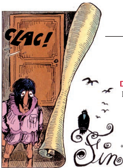
Fred, L'histoire du corbac aux baskets , Dargaud