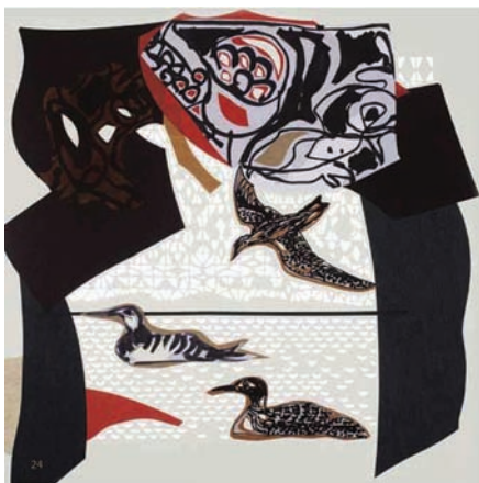
Le huart, illustration de René Derouin