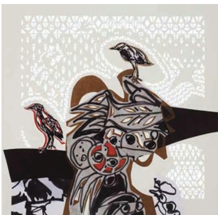
Le moqueur polyglotte, illustration de René Derouin

A ccompagné d'illustrations de René Derouin, dont les tons de rouille, de sépia et de noir épousent au plus près le corps du texte de Robert Lalonde, dont l'unité chromatique s'accorde à merveille au « haut fait surnaturel surgi comme un coup de vent », ce bestiaire à quatre mains nous plonge au cœur de la vie qui bat. La forme et le matériau ici utilisé de papier collé en prolongent tout à la fois la profondeur et la légèreté. Sept oiseaux, mon père et moi se révèle un véritable hymne à l'enfance, l'enfance telle qu'on la souhaiterait pour tous : libre de toute contrainte, tout entière dédiée à la