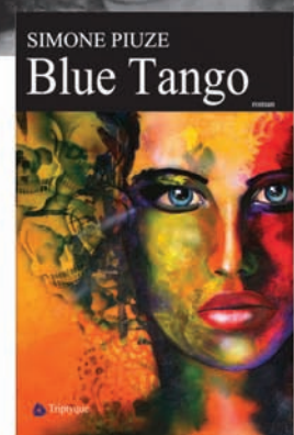
SIMONE PIUZE Blue Tango roman, 323 p., 24 $