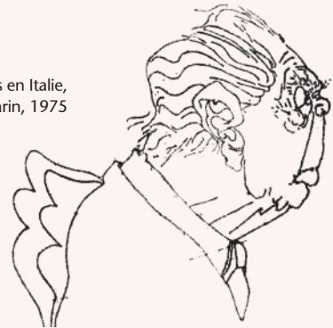
Borges en Italie, caricature de Clarin, 1975

Jorge Luis Borges est mort à Genève en 1986. C'est là qu'il est enterré, au cimetière des Rois. Sur sa tombe, on peut lire, dit-on, cette inscription en ancien anglais : « And Ne Forhedan Na », c'est-à-dire « Et qu'ils ne craignent rien » ou « On ne doit pas avoir peur ».