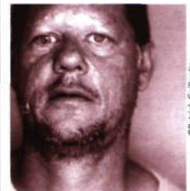
William T. Vollmann