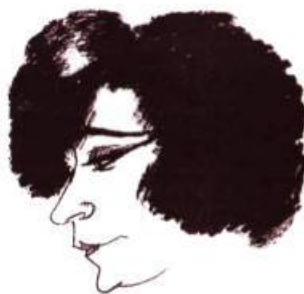
Colette, par Paul Colin