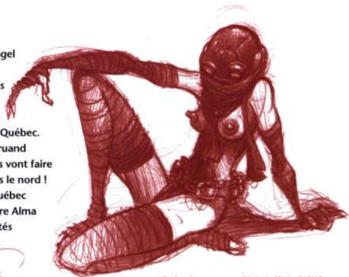
Recherches pour une série intitulée La RAFALE

Mon groupe de punk garage débarque déjà au Québec. La Bonne, la Brute et le Truand et leurs sculptures de sons vont faire remonter les caribous vers le nord ! Après les salles rock de Québec et de Neuville, on découvre Alma et ses jeunes punks déjantés et sacrément accueillants. Puis c'est Montréal où les féministes nous agressent à cause d'une de mes affiches ! Hahahahaha ! Voilà un concert punk comme je les aime où la bassiste du groupe explique son point de vue du féminisme à ces « Chiennes de garde* » à coup de Platformboots !!!!! Du rock, des poils et des étoiles ! Deux mois de bonheur intense ! J'adore ce pays !... Je reviendrai !