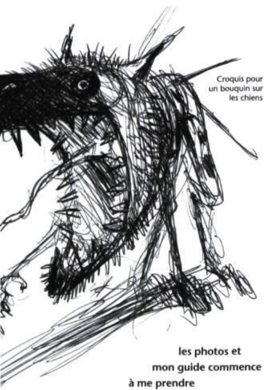
Croquis pour un bouquin sur les chiens

Non, rien ne m'arrêtera Ni le blues à Veracruz Ni la varicelle à Puerto Angel Ni la malaria à Morelia Ni le tétanos à Matamoros