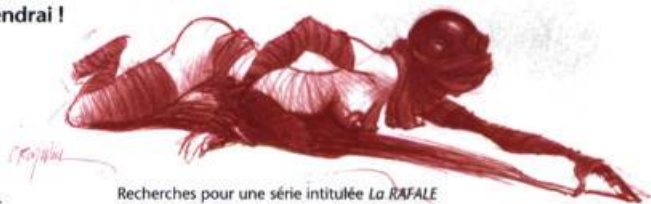
Recherches pour une série intitulée La RAFALE

Non, rien ne m'arrêtera Ni la gale à San Cristóbal Ni les oreillons à Torreón Ni les cojonès à Jiménez Ni les maracas à Las Casas