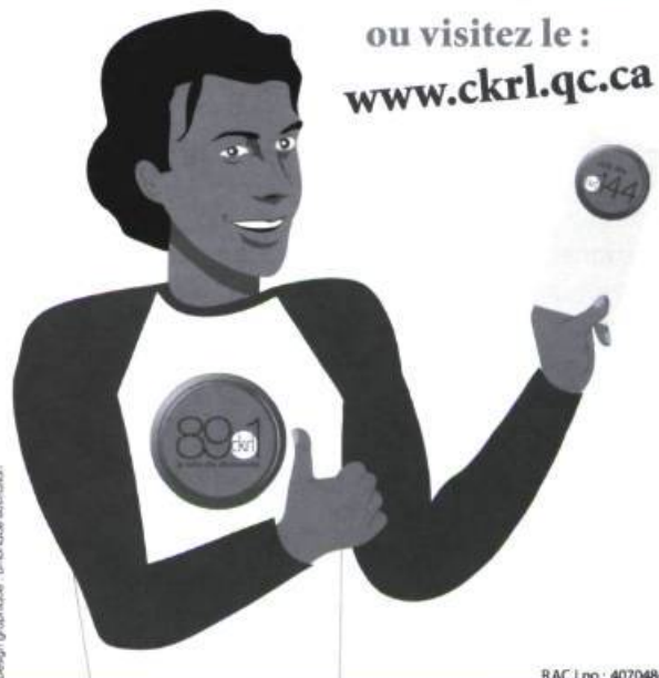
Design graphique : Imronazé Kustafson