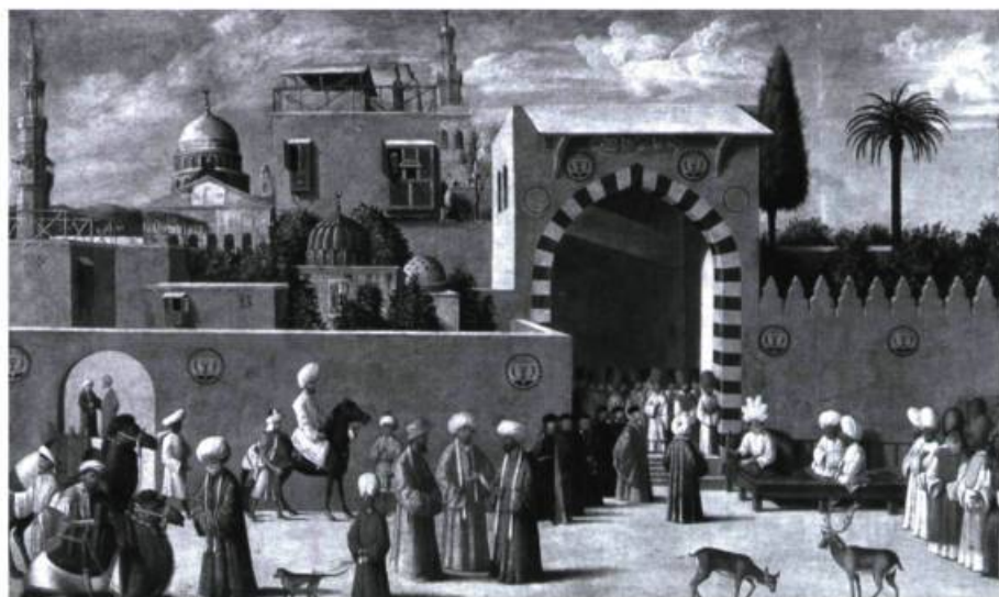
Réception des ambassadeurs vénitiens à Damas, p. 85.

Bien que son auteur soit inconnu, ce tableau qui remonte à 1511 a une portée significative du fait qu'il capte un moment de l'histoire qui a marqué la fin d'une période de commerce entre Mamluks et Vénitiens. Quelques années après sa réalisation, l'Égypte et la Syrie passaient sous domination ottomane.