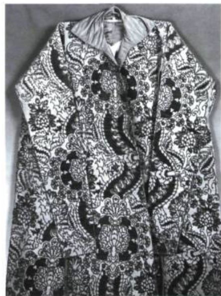
Robe de cérémonie en velours de soie, p. 188.

Enfin, la troisième section de l'ouvrage regroupe toutes les notes du catalogue des pièces exposées. Bien que traitée comme un appendice aux deux précédentes parties (typographie lilliputiennne, iconographie chiche, texte pléthorique), elle nous a paru la section la plus intéressante. Outre les informations habituelles sur la nature de