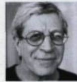
GÉRALD LEBLANC Poèmes New-Yorkais Perce-Neige