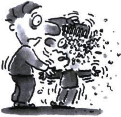
Alexa Gougougaga par Dominique Demers ; illustrations de Philippe Béha.