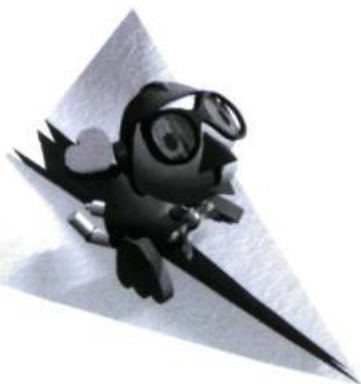
L'enfance de monsieur Edgar par Christiane Duchesne ; illustrations de Pierre M. Trudeau.

– Il est bien sage, notre Edgar, dit tout à coup Monsieur le papa. – Il se repose, dit Madame la maman. Il est tout de même tombé de haut. Dans sa chambre, Edgar s'affaire en silence à plier une grande feuille de papier pour en faire un avion. – Pilote d'avion ! Voilà ce que je serai ! Edgar s'installe dans son grand avion blanc, ouvre la fenêtre de sa chambre et décolle. Il plane, il vole pendant trois secondes... Puis l'avion pique du nez et Edgar atterrit sur la tête. Papa, tu me ré pares ?