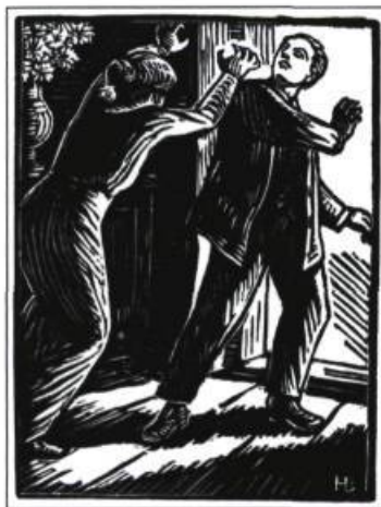
Un simple, Édouard Estaunié, bois gravé par Honoré Broutelle, 1927.

Après avoir défendu Dreyfus durant sa jeunesse, Estaunié choisit la droite, voire l'extrême-droite, puisqu'il signa en 1935 le Manifeste de Massis « Pour la défense de l'Occident », qui approuvait la conquête de l'Éthiopie par Mussolini, et en 1937 le « Manifeste aux intellectuels espagnols », favorable aux franquistes.