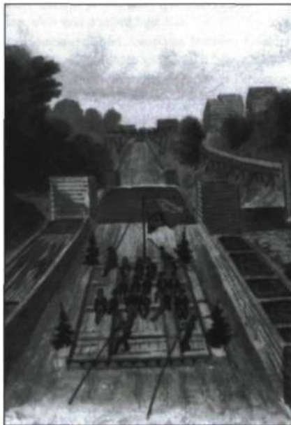
Le Prince de Galles dans l'Outaouais des Raftsmen [Lithographie de T. W. Willegan. 1860. Archives nationales du Canada C-5086.]

L'enracinement de Blisse dans la tradition ne saurait cependant pas gommer son apport original. Par l'art de raconter qu'y déploie l'auteur, cette tétralogie s'avère une œuvre moderne promise à une longue vie. Sa qualité littéraire est perceptible dès le niveau de l'anecdote. Des histoires peu banales nous entraînent dans des recoins inattendus, sans jamais délaissier la trame principale. Un découpage en nombreux épisodes ou scènes crée un rythme dynamique où se fait sentir l'influence du cinéma. Et, quand l'enchaînement l'exige, ellipses et sommaires viennent s'intercaler entre les scènes. Ainsi le découpage permet-il de