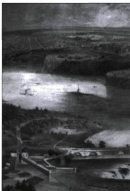
Les Chaudières [Lithographie de Sarony, Major et Knapp, 1857. Archives nationales du Canada C-2812.]

Quant au Cycle de l'instruit , il dévoile enfin « L'extraordinaire secret de Béni Tarentour », secret percé par Francis Bernard. Ce conte lève également le voile sur les sources, jusque-là entourées de mystère, de « L'extase de Laura » du deuxième cycle. Finalement, « La confession de Francis Bernard » clôt la tétralogie. Comme dans le conte précédent, le narrateur y occupe la fonction de héros. Il raconte sa vie au Blisse pendant les mois qu'a duré l'écriture de son livre.