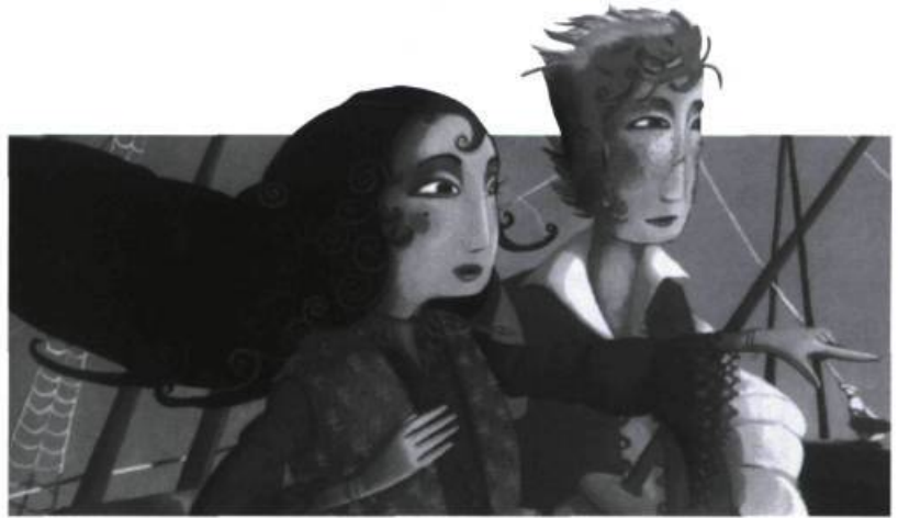
La Princetta et le Capitaine par Anne-Laure Bondoux.