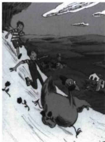
Alfred est revenu à la maison avec nous. Depuis quelques jours, il apprend son rôle de dindon intergalactique [...].