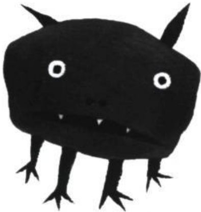
Quelle étrange bête chez moi! par Johanne Gagné; illustrations de Josée Masse.

figés, statiques, détachés de leur environnement. Les questions portent souvent sur le nombre de spécimens, ce qui importe assez peu, alors qu'on néglige les caractéristiques des espèces. Le raton laveur, par exemple, porte ce nom pour un motif qui aurait fasciné l'enfant, tandis qu'« un raton laveur qui grimpe » ne lui apprendra pas grand chose. « Un gnou qui marche » renseigne aussi peu. Belle préoccupation, mais résultats sans relief.