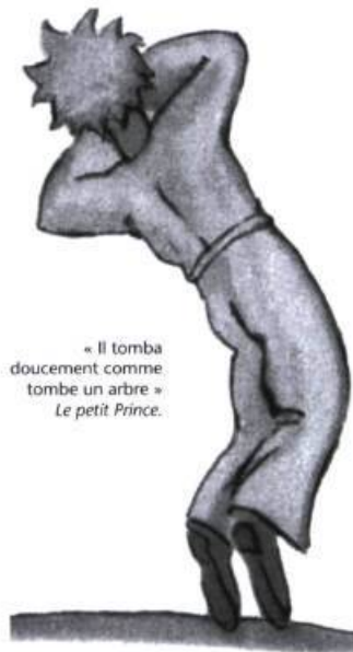
« Il tomba doucement comme tombe un arbre » Le petit Prince.

S'il y a aujourd'hui une poésie acadienne, c'est grâce à certains poètes des années 1970 qui, libres de tout modèle, ont créé des œuvres originales où l'on reconnaît maintenant les traits distinctifs d'une littérature nationale. Gérald Leblanc fut de ceux qui donnèrent le ton à une littérature inventive et parfois virulente. Les éditions de L'Interligne rééditaient cet automne les trois premiers recueils du poète, Comme un otage du quotidien , Géographie de la nuit rouge et Lieux transitoires , réunis sous le titre Géomancie .