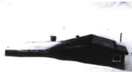
Tempête, près de Kangiqsujuag