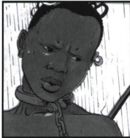
Les passagers du vent, par François Bourgeon.

grecque » liseuse et folle, la voilà dans Brin d'amour aux prises avec des prétendants : Nestorin, alias Youssef Bachour, bâtard-Syrien chrétien d'Orient, Milo Deschamps, ex-mécanicien des usines Peugeot à