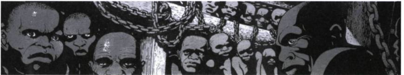
Les passagers du vent, par François Bourgeon.

Rêve...! Un incroyable tournis de flaveurs parfums couleurs bruits peaux tam-tam. Écriture des amples vents balayant les eaux du monde dispersé se liant dans le tourment infini de l'errance, l'indéterminé.