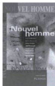
Nouvel homme recueil de nouvelles Sous la direction de Stephan Hardy

Nouvel homme se veut une exploration par la littérature de l'évolution récente de la masculinité. On y retrouve des nouvelles de tout genre — science-fiction, réalisme, suspense, conte fantastique — possédant cependant une particularité : celle de mettre en valeur des aspects non stéréotypés de la masculinité.