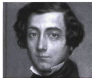
Alexis de Tocqueville