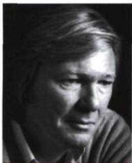
Jacques Sassié / Gallimard