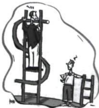
La lutte des classes

On lira avec intérêt un second recueil de Marie Pascale Huglo. Peaux est constitué de quatre nouvelles qui explorent un monde somato-psychique. Grattée, tendue, déchirée, embaumée, admirée ou même couverte de lésions, la peau occupe le seul vrai premier rôle de ce surprenant recueil .