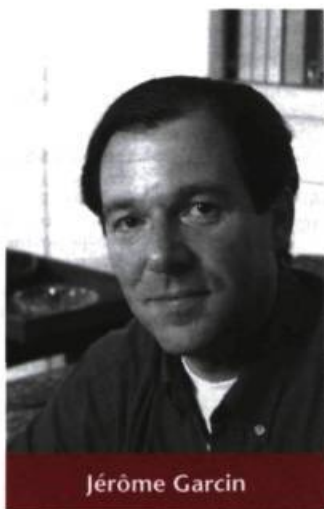
J. Sassiery/Opale Jérôme Garcin

Qui aurait cru lire un jour un vade-mecum du bonheur signé de « l'inventeur » du pessimisme ? Ceux qui liront L'art d'être heureux , À travers cinquante règles de vie d'Arthur Schopenhauer (Le Seuil, traduction Jean-Louis Schlegel) comprendront que, pour l'auteur de Le monde comme volonté et comme représentation , être heureux c'est accommoder son malheur. Ici, donc, plutôt l'absence de souffrance que la multiplication des bonheurs.