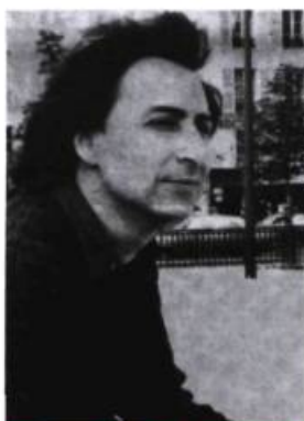
La Quinzaine littéraire

Les sept jours où le monde fut pillé d'Aleksei Tolstoï, écrit en 1924, maintenant traduit par Paul Lequesne à l'Esprit des péninsules, a bonne presse comme le roman précédent, Ibycus.