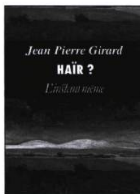
Häir ? Jean-Pierre GIRARD Nouvelles 167 pages, 19,95 $