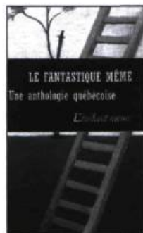
Le fantastique même Une anthologie québécoise Anthologie rassemblée et présentée par Claude GRÉGOIRE 238 pages, 14,95 $ POCHÉ