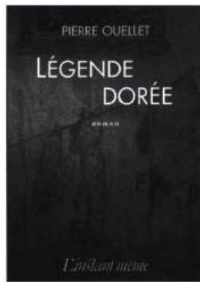
Légende dorée Pierre OUELLET Roman 212 pages, 24,95 $