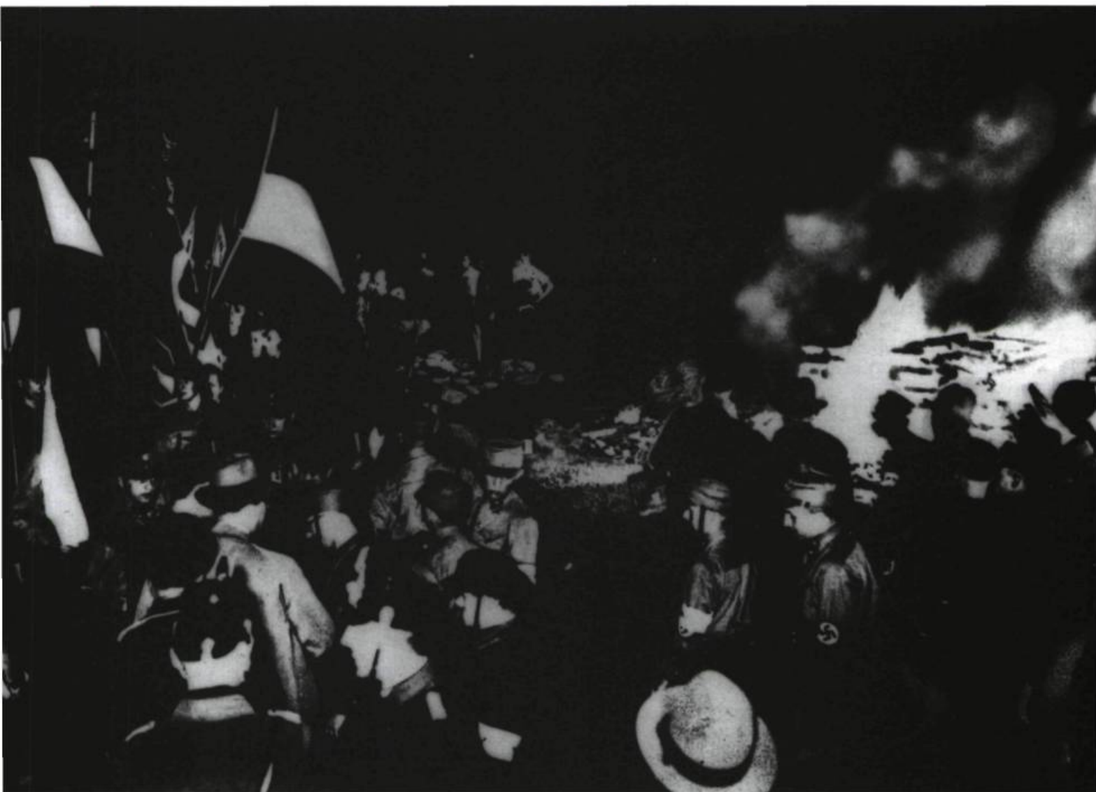
L'incendie du Reichstag de Berlin en février 1933.

asile en France renforce les nouveaux dirigeants nazis dans le choix de leurs cibles ; l'émancipation des Juifs, le libéralisme et le mouvement ouvrier marxiste sont à leurs yeux les fruits des « idées françaises de 1789 », source de tous les maux des temps modernes, et la France, la véritable patrie des émigrants dissidents. Pour extirper le mal, il faut soumettre la France – et briser sa prétention d'être le flambeau de la civilisation dans le monde – par les armes ; ainsi une deuxième guerre donnera enfin la victoire aux « idées allemandes de 1914 », dûment modernisées. C'est ce qui semble avoir réussi en 1940, avec l'occupation de la France. Rien d'étonnant à ce que l'extradition des exilés, coupables, selon la ter-