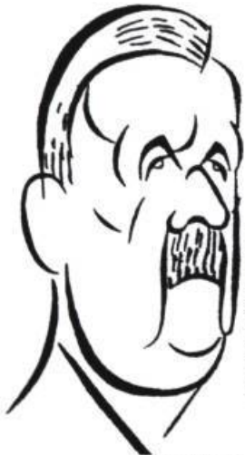
illustration : Eva Herrmann