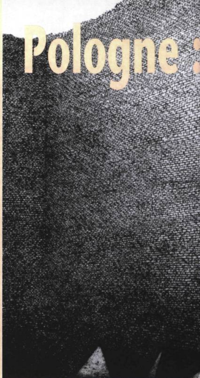
Tadeusz Michal Siara, « Ciel au-dessus de la tête », eau-forte, 1973.

N e nous surprenons donc pas si, qu'il se porte sur le présent ou le passé, le regard polonais enrobe d'ambiguïté même les souvenirs les plus nets. Les retours de la mémoire 1 de Hanna Krall n'ont d'ailleurs que faire de la clarté cartésienne. Il suffit à l'auteur d'une évocation, d'une allusion pour qu'aussitôt les ombres qu'elle invite à témoigner recréent la terreur nazie et l'horreur des camps. Un peu comme ces tableaux où le pinceau se borne à poser des taches dont le message se distille lentement, la fresque d'Hanna Krall prend forme imperceptiblement, par une lente connivence des anecdotes, des rappels, des douleurs et des humiliations. Les questions n'en émergent qu'avec plus de force. Pourquoi la haine ? Pourquoi faut-il tuer ? Pourquoi ce racisme même chez les victimes ? Pourquoi ces vies fauchées injustement ou flétries à jamais ?