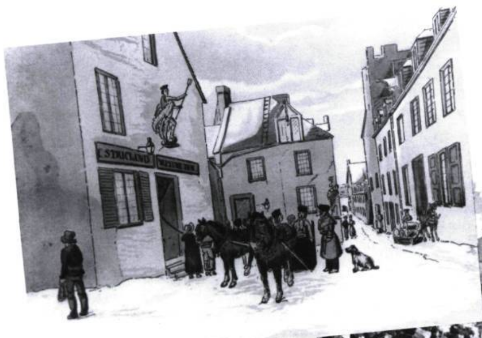
L'Hôtel Neptune à Québec, 1830, d'après un dessin du Colonel Cockburn