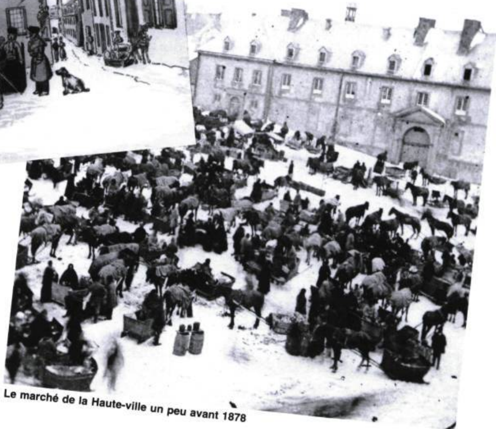
Le marché de la Haute-ville un peu avant 1878

Les habitants arrivent avec leurs traditions et leurs coutumes françaises, mais bientôt s'en démarquent : influence du climat, mais aussi des Indiens, qui ne se sont pas contentés d'enseigner aux colons comment soigner le scorbut, mais encore comment faire face au climat, comment trapper, comment faire la guerre d'embuscade, et surtout que les mœurs françaises ne sont pas le seul modèle.