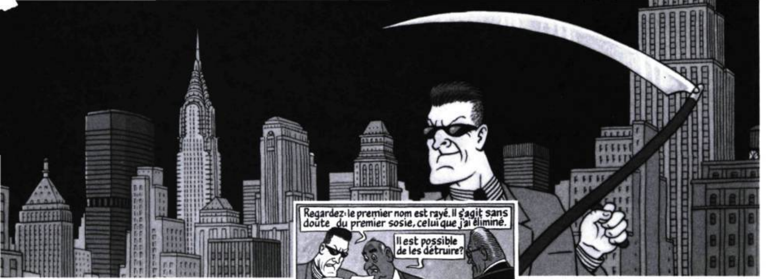
Red Ketchup contre Red Ketchup, par Réal Godbout et Pierre Fournier