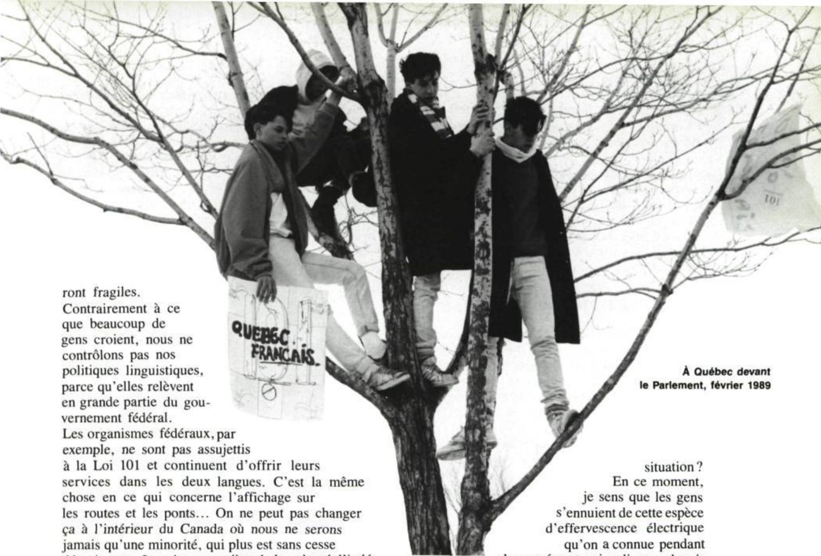
À Québec devant le Parlement, février 1989

ront fragiles. Contrairement à ce que beaucoup de gens croient, nous ne contrôlons pas nos politiques linguistiques, parce qu'elles relèvent en grande partie du gouvernement fédéral.